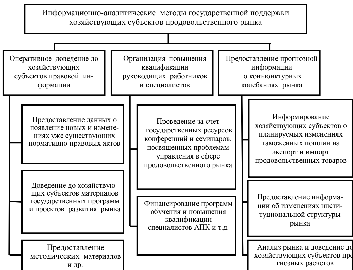
Рис. 3. Информационно-аналитические методы государственной поддержки хозяйствующих субъектов продовольственного рынка

Однако пока еще нельзя сказать о высокой эффективности информационного сопровождения рынков продовольственных товаров в нашей стране. На наш взгляд, существующая структура требует расширения путем введения в ее состав межрегионального уровня.