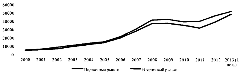
Рис. 1. Динамика стоимости жилья на первичном и вторичном рынках в Белгородской области, руб.

График, приведенный на рис. 1, наглядно иллюстрирует стремительный рост цен на жилье в регионе. Наибольший темп прироста на первичном рынке за весь рассматриваемый период наблюдался в 2007 году, по сравнению с 2006 годом цены на жилье выросли на 42,3%. В 2008 году стоимость жилья стала падать, что обусловлено мировым финансовым кризисом. Наибольшее снижение цен было зафиксировано в 2010 году, по сравнению с предыдущим годом цены на недвижимость упали на 6,7%. Падение цен на жилье связано с падающим спросом в связи со снижением уровня доходов населения, а также с нестабильной ситуацией во всех смежных отраслях со строительством. В 2011 году рынок недвижимости постепенно стал восстанавливаться и начал характеризоваться ростом цен. За первое полугодие 2013 года цены на первичное жилье выросли на 10,8%, что является выше среднего в целом по стране[1]. Всего за период с 2000 по первое полугодие 2013 года цены на недвижимость возросли на 932,9%. Темпы прироста цен на недвижимость на первичном и вторичном рынках приведены в таблице 2.