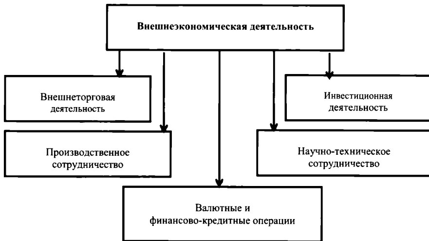
Рис. 1. Виды внешнеэкономической деятельности

По нашему мнению, основными формами внешнеэкономической деятельности, которые в той или иной мере включают остальные, являются внешнеторговая деятельность и международная инвестиционная деятельность.