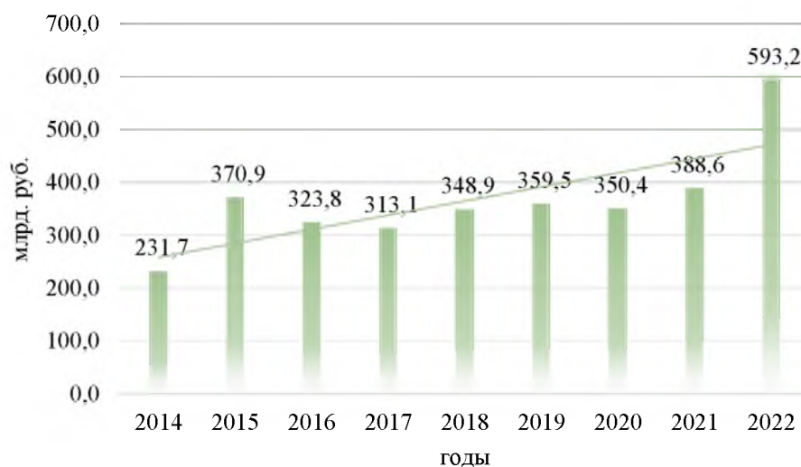
Рис. 3 – Инвестиции в основной капитал организаций туриндустрии в РФ, млрд. руб.

Ввиду особого внимания правительства РФ к параметру инвестиций для развития туристской отрасли, рассмотрим динамику данного показателя (рис. 3).