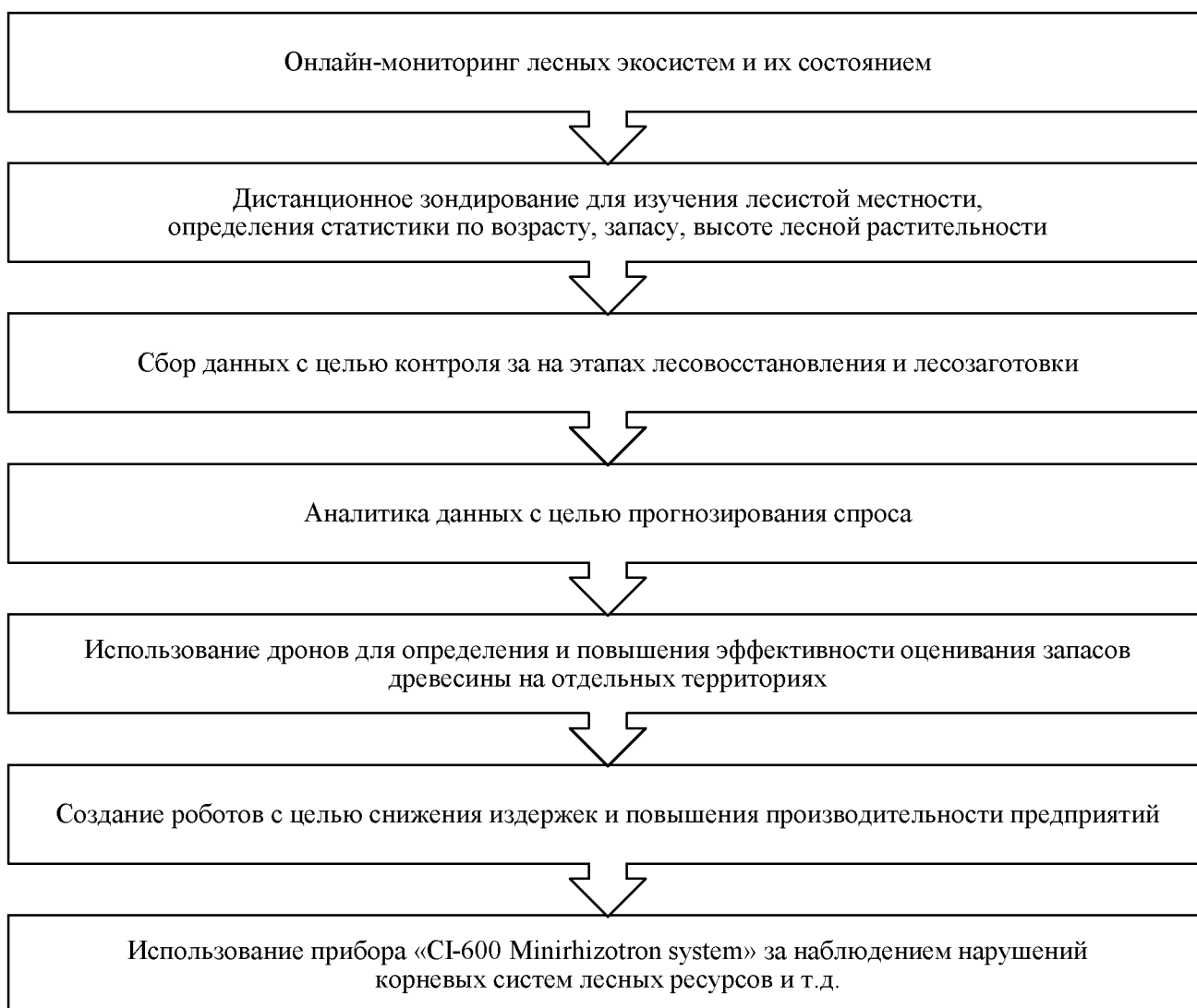
Рис. 3 – Цифровые технология для улучшения лесного хозяйства

Для более детального рассмотрения был проведен анализ с целью сравнения двух моделей лесопромышленного комплекса (таблица 2) [5].