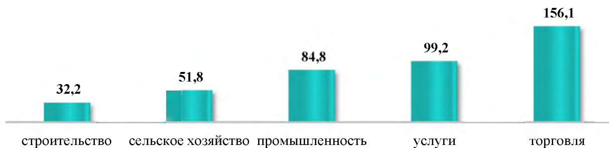
Рис.3 – Число вновь созданных малых предприятий и микрофирм по видам экономической деятельности за 2020-2022 гг., в тыс. ед. [7]

При анализе вновь созданных малых предприятий и микрофирм по отраслям экономики следует отметить, что наибольшее количество новых субъектов было создано в сфере торговли – 156 069 (или 36,8 %), сфере услуг – 99 198 (или 23,4 %), промышленности – 84 830 (или 20,0 %), сельском, лесном и рыбном хозяйстве – 51 752 (или 12,2 %), строительстве – 32 224 (или 7,6%) (Рис.3).