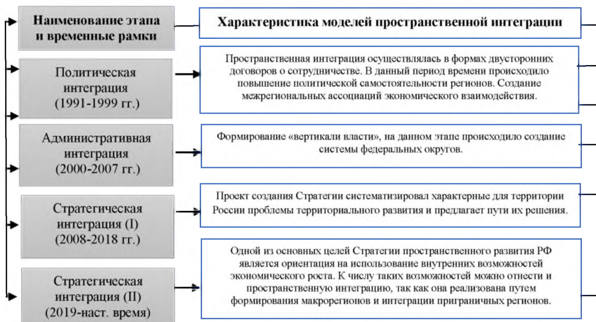
Рис. 1 – Эволюция моделей пространственной интеграции в условиях трансформации экономического пространства

Предлагаем рассмотреть эволюцию моделей пространственной интеграции в условиях трансформации экономического пространства, представленную на рисунке 1.