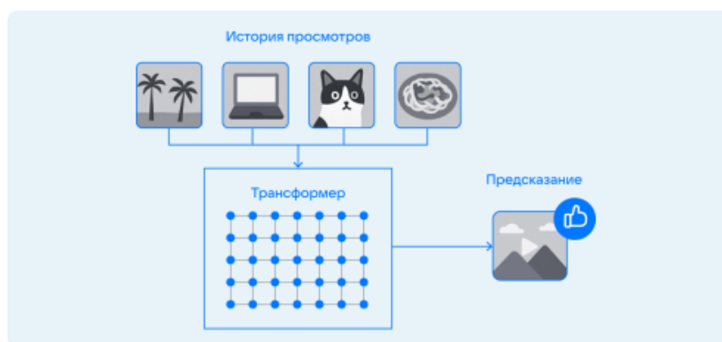
Рис. 1. Иллюстрация механизма self-attention на платформе VK Fig. 1. Illustration of the self-attention mechanism on the VK platform

Инфографика – еще один широко используемый в сетевых просветительских СМИ вид контента, который делает информацию более наглядной, помогает упростить ее восприятие, что особенно значимо, если информация отличается объемом и сложностью. В качестве примера приведем публикацию «Рекомендуешь. Как разработчики AI VK создают систему рекомендаций контента» [Король, Беседина, 2025] на платформе онлайн-проекта о науке и технике «N+1», где авторы активно используют различные приемы создания инфографики (рис. 1), что помогает аудитории погружаться в тему и точнее интерпретировать информацию.