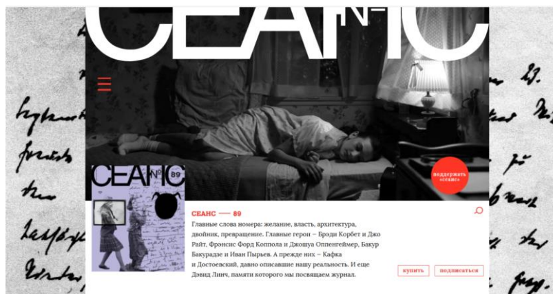
Рис. 3. Верстка онлайн-журнала «Сеанс» Fig. 3. Layout of the online magazine "Seans"

общем ярком многоцветном фоне черно-белую цветовую гамму [Степанов, 2025], а публикации, цитаты или заголовки, которым придается особое значение, всегда выделяются цветом и чаще всего красным (рис. 3). Иллюстрации и фотографии в онлайн-версии журнала «Сеанс» (как и в его печатном варианте) выдержаны в черно-белом формате, что делает их особенно выразительными и привлекающими внимание.