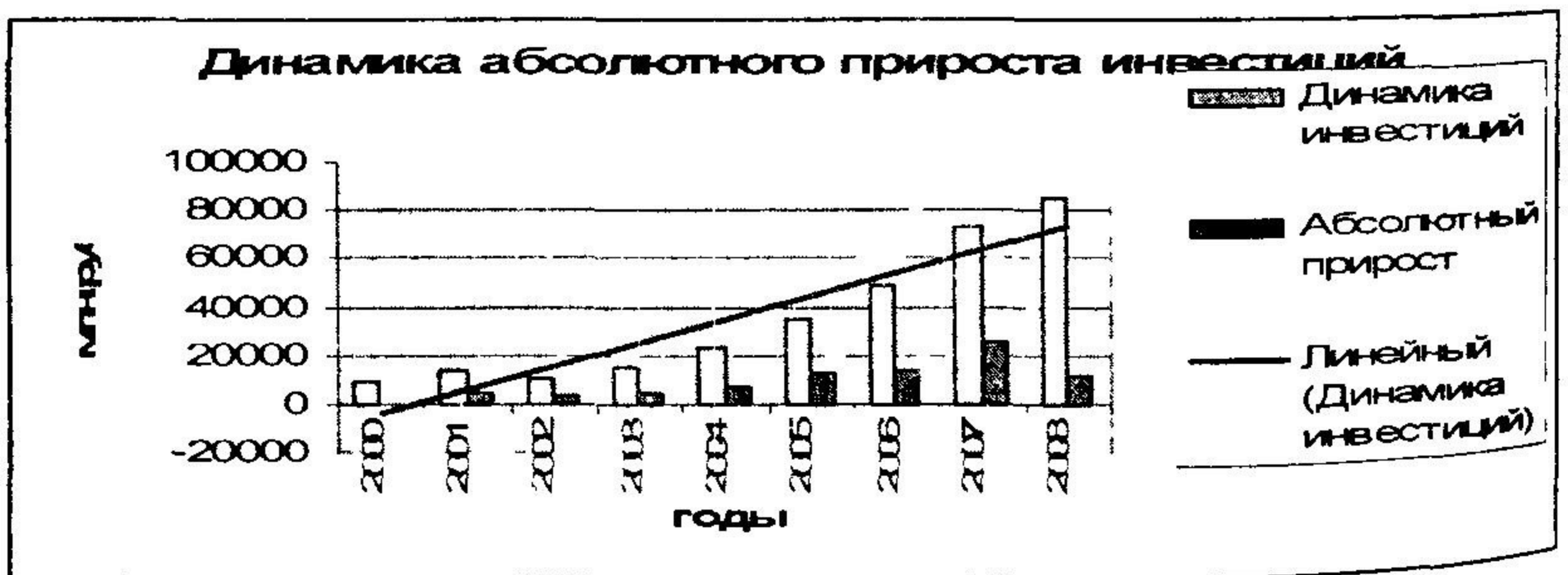
Рис 1 Динамика абсолютного прироста инвестиций

Несмотря на экономический кризис, в целом, ситуация изменилась не сильно. В 2008 году рост инвестиций все еще имел место быть (темп прироста составил 15,1%). Нельзя и твердо утверждать о том, что в 2009 году роста не будет вообще, только судя по тенденции двух кварталов 2009 года. Кстати и эти данные не являются удручающими, снижение инвестиционной активности на 28,9% по сравнению с 2008 годом может также говорить о неспособности инвесторов вкладывать свои деньги вследствие их тяжелого экономического положения.