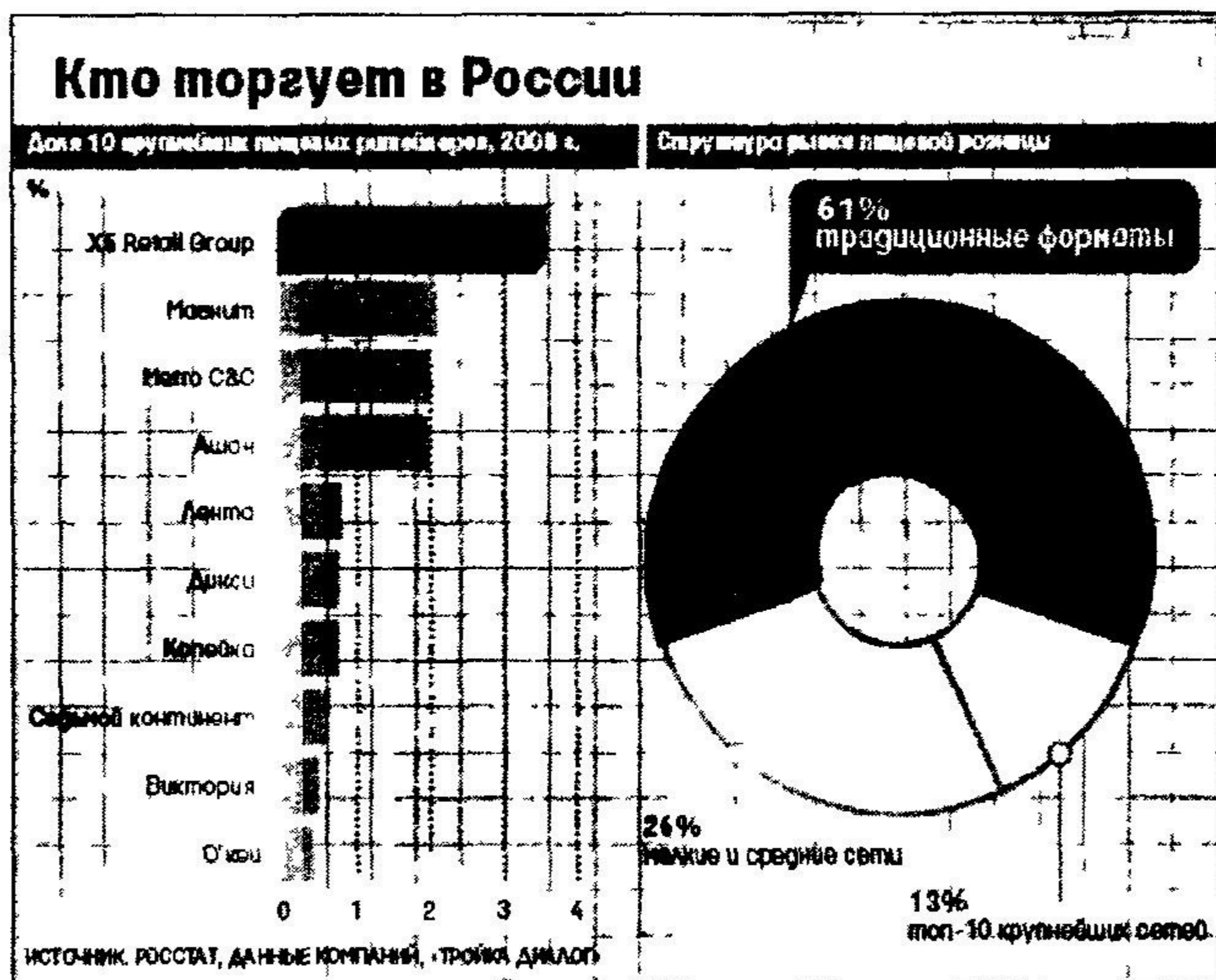
Рис 2 Топ-10 крупных торговых сетей России по обороту и позиционированию в 2008 г

В десятке лидеров продовольственной розницы в России совокупная доля зарубежных сетей составляет около 30%. Крупнейшим региональным рынком является, естественно, столичный. В 2008 году оборот розничной торговли г. Москвы составил более 2400 млрд. рублей. На территории Москвы действует порядка 200 торговых комплексов, причем обеспеченность качественными торговыми площадями в некоторых районах города является самой высокой не только в России, но и по сравнению европейскими городами. В Московском регионе роль рынков достаточно высокая, в каждом районе Москвы (особенно на окраинах) организована рыночная торговля, которая пользуется популярностью у горожан. В Москве доля продаж товаров на вещевых, смешанных и продовольственных рынках в 2008 году составила около 18%, а в Московской области – 9,6%.