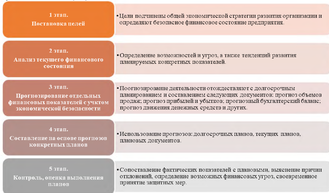
Рисунок 2 – Стадии финансового планирования

Финансовое планирование поэтапный процесс, состоящий из несколько стадий, представленных на рисунке 2.