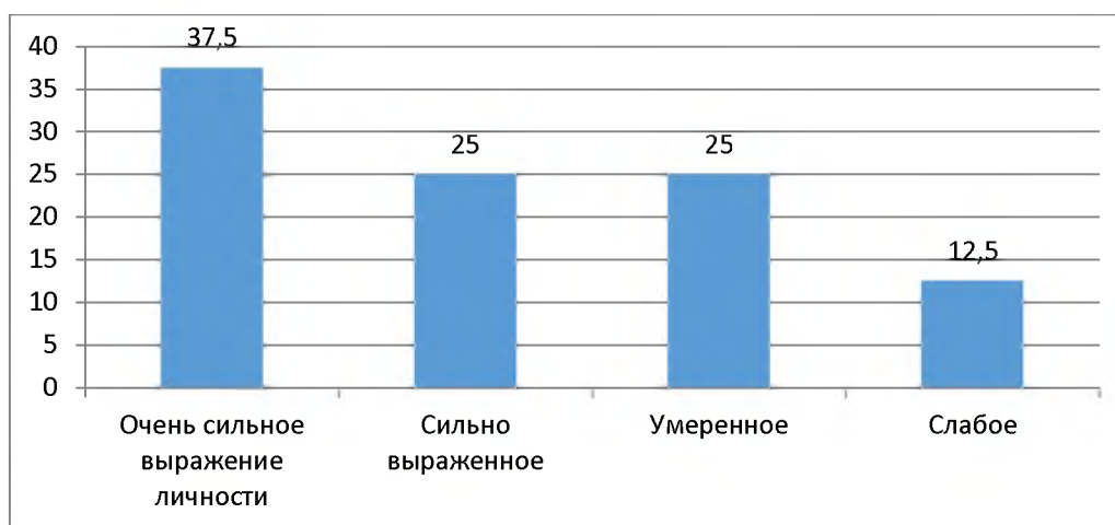
Рис.3. Параметр «чувство неприкаянности» («бездомность») Figure 3. Parameter “feeling of inaccessibility” (“homelessness”)

Таким образом, наиболее свойственно опрошенным пожилым и престарелым людям – клиентам МБУ СОССЗН «Комплексный центр социального обслуживания населения» Ивнянского района Белгородской области – чувство одиночества, безнадёжности, неприкаянности; отсюда и умеренный враждебный настрой.