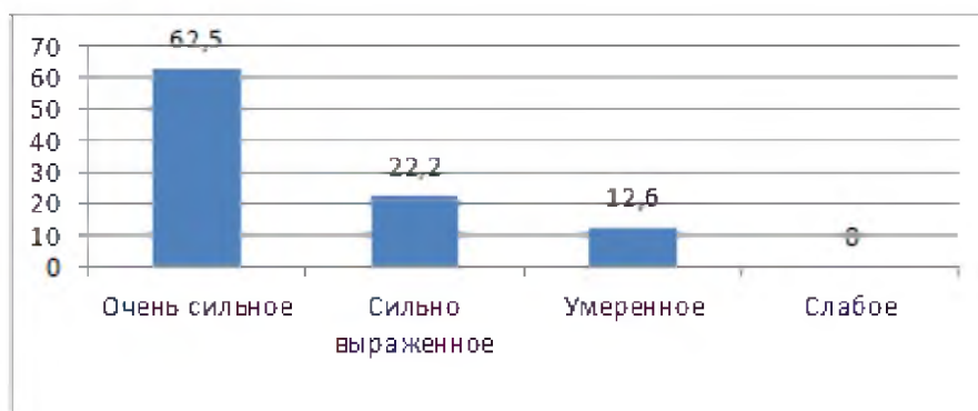
Рис.1. Параметр «чувство одиночества» Figure 1. Parameter “feeling of loneliness”

Как показали результаты по опроснику А.Т. Джерсайлд, большинство обследованных нами пожилых и престарелых людей ощущают сильное чувство одиночества (Рис.1):