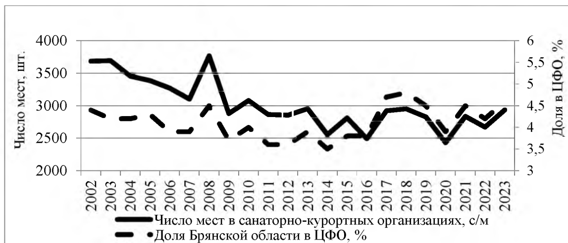
Рис. 3. Динамика числа мест в санаторно-курортных организациях Брянской области и изменение доли региона в ЦФО

Число мест в санаторно-курортных организациях за этот период характеризуется большей стабильностью – коэффициент вариации не превышает 13 % (рис. 3).