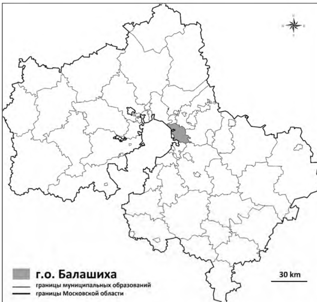
Рис. 1. Местоположение городского округа Балашиха на карте Московской области Fig. 1. Location of Balashikha urban district on the map of Moscow Oblast