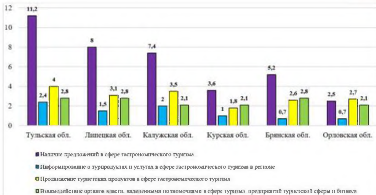
Рис. 1. Результаты оценки эффективности туристской деятельности в сфере гастрономического по базовым критериям Fig. 1. The results of evaluating the effectiveness of tourism activities in the field of gastronomy according to basic criteria