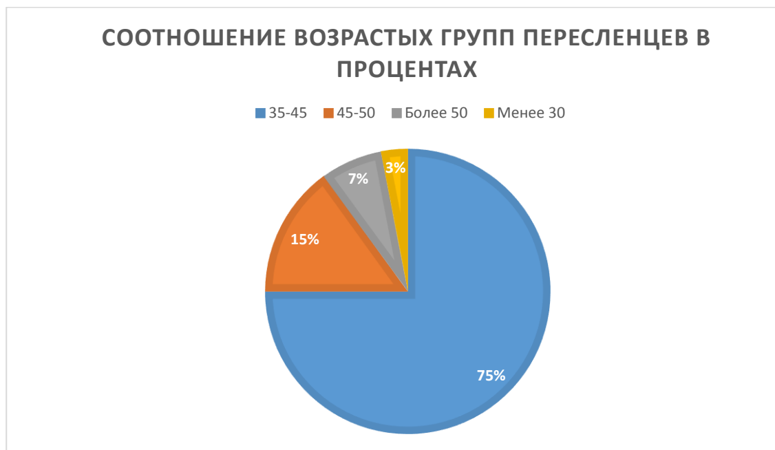
Диаграмма 1. Данные о возрасте мужчин-переселенцев в 1704-1714 гг.

(Диаграмма 1). Редкими были случаи, когда переселенцам было более 50 лет и менее 30 лет. Что касается соотношения мужчин и женщин, то численность представительниц женского пола преобладала: они составляли около 65 % переселяемых. Это связано с тем, что женщин в Шацком уезде было в целом больше. Показательно, что дети до 16 лет были в составе 68 % переселенцев. Вероятно, наличие молодых мужчин было важным фактором при переводе на новое место жительства.