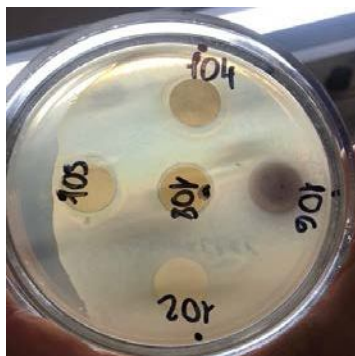
Рис. Antifungal activity of the soil strains 102, 103, 104, 106, and 108 towards Clavibacter michiganensis

Проведенные исследования позволили выделить микроорганизмы, обладающие искомыми свойствами. Так, выделен ряд актинобактерий, способных к деструкции бензоата как модельного соединения, отражающего способность микроорганизмов разлагать ароматические соединения. По способности синтезировать пигменты были отобраны продуценты вторичных метаболитов. Было показано, что культуральная жидкость, полученная при выращивании ряда штаммов в богатой среде Лурия-Бертани, проявляла выраженный антимикробный эффект. На рисунке представлены данные по подавлению роста Clavibacter michiganensis subsp. michiganensis VKM Ac-1403 культуральной жидкостью некоторых из выделенных бактерий.