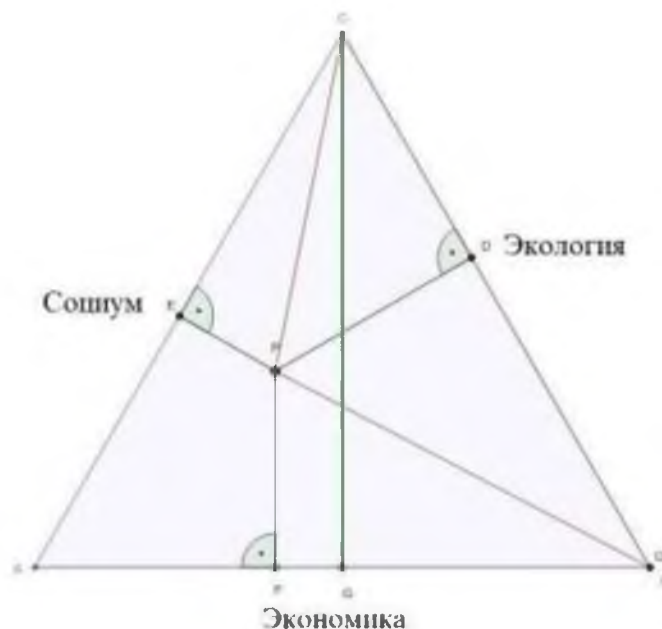
Рис. 3. Теорема Вивиани для равносоставленного треугольника Социум-Экология-Экономика с равноценными для общества сторонами.

При геометрическом подходе в управлении балансировкой развития региональной пространственно-отраслевой структуры (РПОС) в условиях перехода к цифровой экономике определенного результата можно добиться путем применения теоремы Вивиани, когда рассматривается свойство равносоставленного треугольника Социум – Экология – Экономика (с равноценными для общества сторонами). Характерно, что при выборе в треугольнике произвольной точки сумма высот получившихся трех треугольников равняется высоте исходного треугольника (рис. 3).