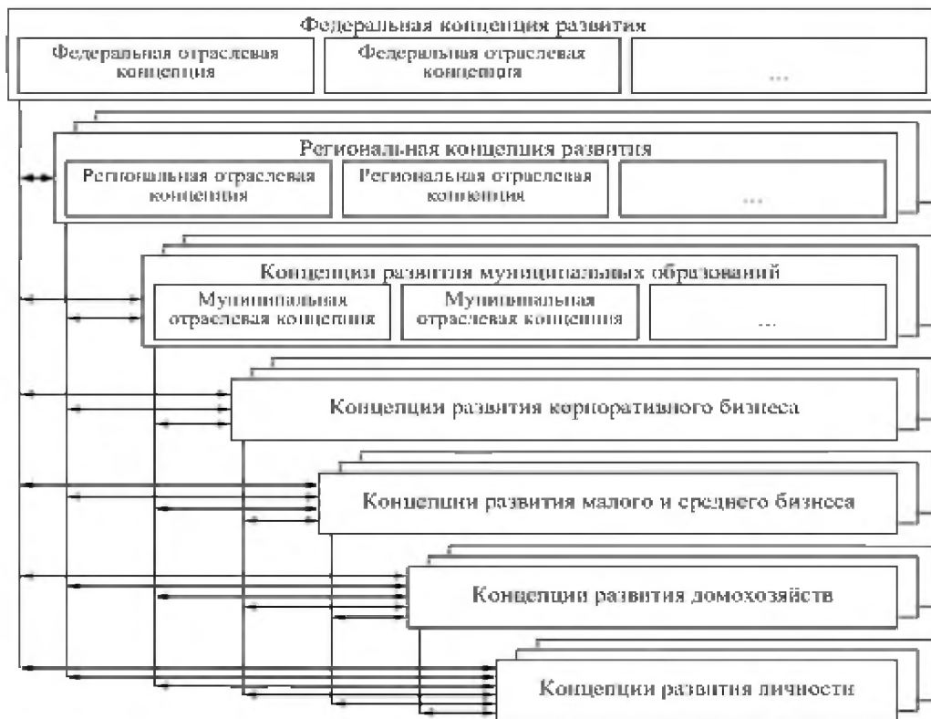
Рис. 4. Взаимосвязь концепций развития для различных уровней управления [Карпов, Калачин, 2003 – переработано и дополнено по уровням, авт.]

Определение параметров балансировки РПОС изначально осуществляется на концептуальном уровне представления сущности и особенностей развития на разных уровнях управления (концепция – от лат. conceptio – понимание, система) рисунок 4 [Карпов, Калачин, 2003 – переработано и дополнено по уровням, авт.]