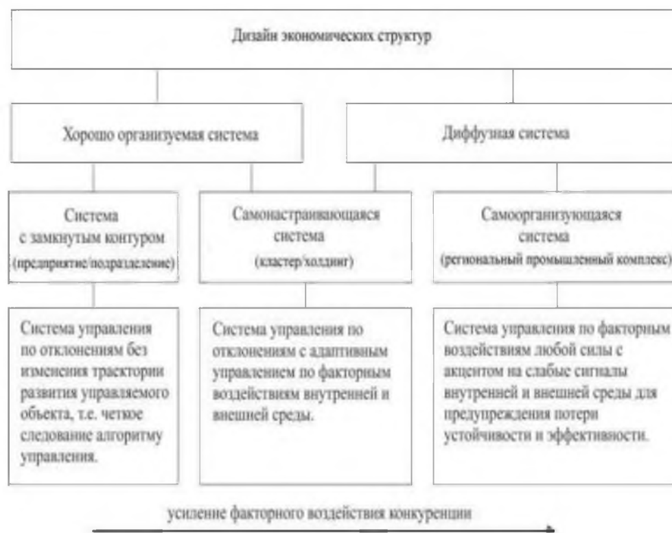
Рис. 2. Типы систем управления в региональной пространственно-отраслевой структуре как результат дизайна экономических структур (в т.ч. региональный промышленный комплекс)

В теории и методологии дизайна экономических структур выделены аспекты, основанные на теоретических положениях, разработанных И.Р. Пригожиным, его коллегами и их последователями [Пригожин, Николис, 1979; Пригожин, Стенгерс, 1986], которые схематично сведены на рисунке 2 [Мишарин, 2017].