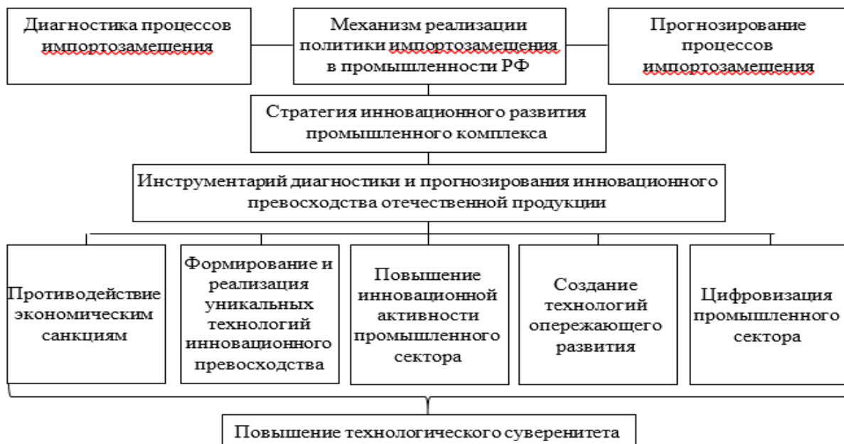
Рис. 1. Инструментарий диагностики и прогнозирования «инновационного превосходства отечественной продукции» в современных условиях