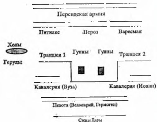
Рис 1. Расстановка войск перед началом сражения около Дары.