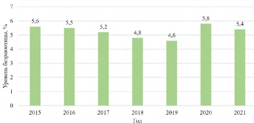
Рис. 1. Уровень безработицы в России, %

В сложившихся условиях некоторые рабочие места остались невостребованными, уровень безработицы в стране в 2020 году значительно увеличился (рис. 1).