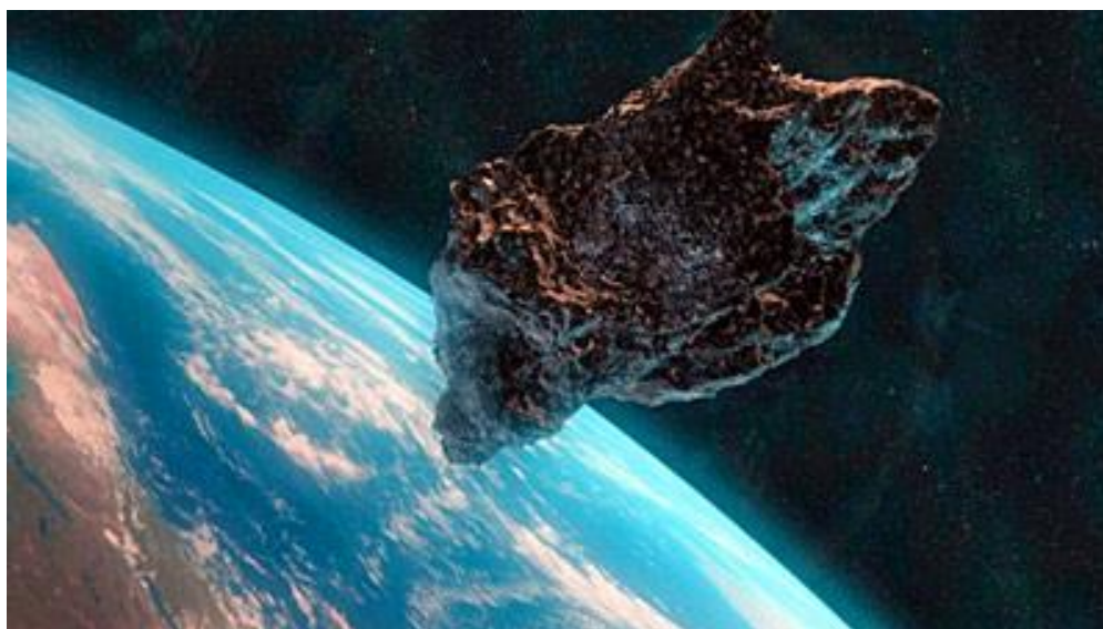
Рис. 1. Вид астероида, приближающегося к Земле

Астероид – относительно небольшое небесное тело Солнечной системы, движущееся по орбите вокруг Солнца. Астероиды значительно уступают по массе и размерам планетам, имеют неправильную форму и не имеют атмосферы [https://ru.wikipedia.org; Аплонов, 2001; Сорохтин, Ушаков, 1991, 2002; Хаин, Ломидзе, 1995] (рис. 1).