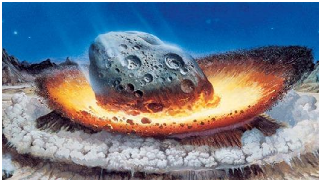
Рис. 2. Характер взаимодействия астероида с твердой поверхностью Земли.

Падение метеорита или астероида на поверхность Земли в настоящее время может привести к катастрофическим последствиям (рис.2).