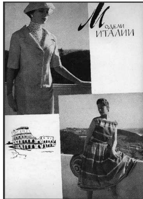
Рис. 7. Модели Италии. Журнал мод. 1958. № 1. Fig. 7. Models of Italy. Fashion magazine. 1958. No 1.

Интересен факт появления в первом номере «Журнале мод» за 1958 г. раздела «Модели Италии». В нем представлены семь фотографий женщин в элегантных платьях и костюмах. При этом фотографии, в отличие от идентичных изображений советской моды, не сопровождаются текстовым описанием. Более того, все они, кроме одной, черно-белые, что затрудняло повторение читательницами образов итальянских моделей. Образы итальянской моды, представленные в этом номере, выглядят довольно стереотипно – красивые женщины в шляпках и перчатках представлены на фоне средиземноморских пейзажей, страницы украшают карандашные зарисовки известных достопримечательностей (рис. 7-8). Таким образом, данная публикация скорее показала иллюстрации культурной жизни европейской страны, чем предоставила образы, которые могли быть легко повторены советскими женщинами.