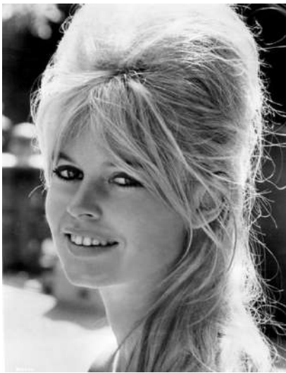
Рис. 9. Прическа исполнительницы главной роли в фильме «Бабетта идет на войну», Брижит Бардо

Другой способ повторить стиль любимых актеров – воспроизведение женских причесок. Прически было легче скопировать, чем модели одежды (Дашкова, 2020: 44). Так, самой известной советской прической 1960-х гг. считается «бабетта», увиденная советскими женщинами во французском фильме «Бабетта идет на войну» (рис. 9).