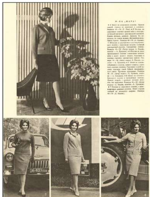
Рис. 3. Образы для повседневной жизни. «Рижские моды». Весна-лето 1965 Fig. 3. Images for everyday life. Riga Modes. Spring-summer, 1965