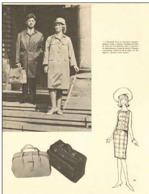
Рис. 2. Образы для повседневной жизни. «Рижские моды». Весна-лето 1965 Fig. 2. Images for everyday life. Riga Modes. Spring-summer, 1965

представлены костюмы для различных ситуаций – для вечерних выходов, активного отдыха, работы в саду и огороде, домашнего времяпрепровождения и даже ночные рубашки и пижамы для сна.