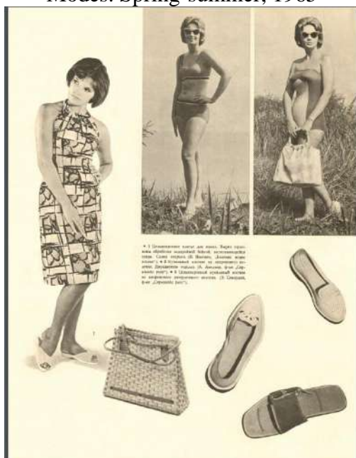
Рис. 4. Образы для повседневной жизни. «Рижские моды». Весна-лето 1965 Fig. 4. Images for everyday life. Riga Modes. Spring-summer, 1965

Заметим, что для некоторых участников модного дискурса покупка специальных изданий о моде представлялась нерациональным расходом средств. В частности, многие женщины, читающие журналы «Работница» и «Крестьянка», пользовались выкройками, размещенными на последних страницах этих изданий. Это позволяло сэкономить деньги, поскольку в женских журналах читательницы находили и рецепты приготовления блюд, и советы врачей, и новости о государственных мероприятиях, и художественное творчество, и модные образы. Кроме того, язык изложения материалов о стиле в этих журналах был более доступным для широкого круга читателей, чем описание фасонов одежды в «Журнале мод».