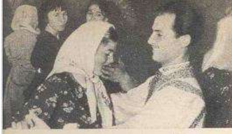
Рис. 1. Участники ситцевого бала. Фото из журнала «Крестьянка». 1963. № 8 Fig. 1. Participants of the calico ball. Photo from the magazine Krestyanka . 1963. No. 8.

ющие участники бала (рис. 1), из чего следует, что для автора факт победы девушки с определенным фасоном платья не так важен, как описание мероприятия. Важно подчеркнуть, что большинство нарядов были пошиты вручную участницами бала, но оценивал образы художник-модельер, то