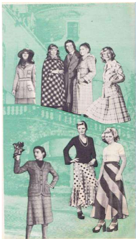
Рис. 5. Образы польской моды. «Работница». 1974. № 7

и представляют читательницам теоретические рассуждения о моде. Так, в № 7 «Работницы» за 1974 г. была размещена «Многоуважаемая мода», которая представляет собой попытку проанализировать модный дискурс в Польше – стране социалистического лагеря. В публикации мода предстает как положительное явление, способствующее развитию легкой промышленности, а женщины, покупающие новые фасоны платьев, называются смелыми и одаренными острым чувством момента. Автор рассказывает о модных в Польше весной 1974 г. «длинных юбках из разноцветных, завихряющихся в спираль полос», которые совершенно не практичны в повседневной жизни, но очень женственны (рис. 5).