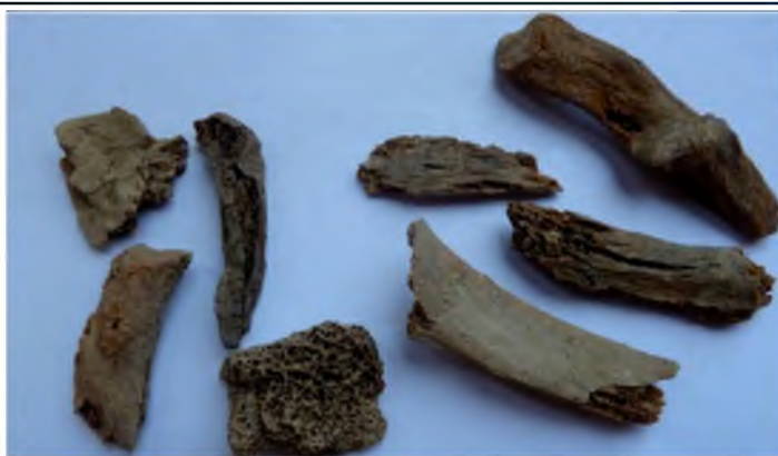
Рис. 2. Один из сосудов, где были помещены кремированные останки (фрагменты ребер, позвонков, пог. 28) Fig. 2. One of the vessels, which were placed the cremated remains bones (fragments of ribs, vertebrae, burial 28)