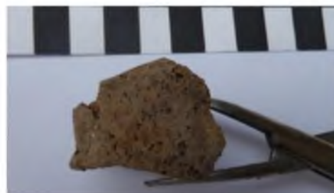
Рис. 1. Сосуд, где были помещены кремированные останки

(фрагменты ребер, деформированный позвонок по типу рыбьих, пог. 20)