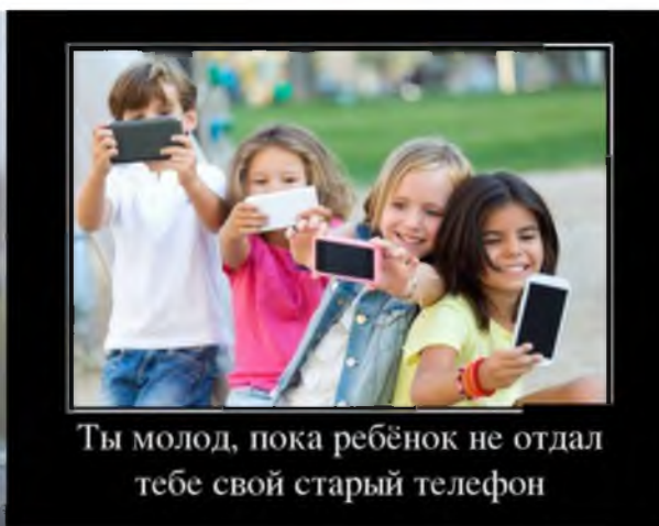
Рис. 2 Fig. 2

Данное определение акцентирует внимание на нескольких важных аспектах. Во-первых, подчеркивается функционирование интернет-мема в рамках интернет-коммуникации, это означает, что сферой употребления интернет-мема является интернет, который выступает и средой возникновения и платформой для тиражирования интернет-мемов. Функционирование интернет-мема в интернет-коммуникации также делает его информационным явлением, вовлеченным в ряд интернет-процессов, присущих интернету в целом (например, анонимность информации, нарушение речевого этикета и т.д.). Данные процессы неизбежно проецируются на интернет-мем, влияя на его природу.