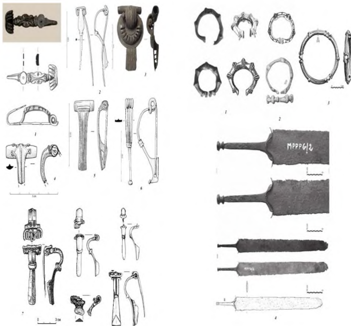
Рис. 2. Фибулы: 1 – фибула типа Münsingen (по Landry, Blaizot 2011: 164); 2 – фибула типа Kragenfibeln (по Feugère 1985: pl. 80, n°1085); 3 – фибула типа Distelfibeln (по Babelon, Blanchet 1895: n°1737); 4 – фибулы типа Nertomarus (по Feugère 1985: pl.168, n°E2); 5 – фибулы типа Nertomarus варианта Лангтон-Доун (по Feugère 1985: pl.93, n°1231); 6 – фибулы типа Jeserine (по Feugère 1985: pl.85, n°1149); 7 – «глазчатые» фибулы (по Белевец 2014: 162). 1: без масштаба