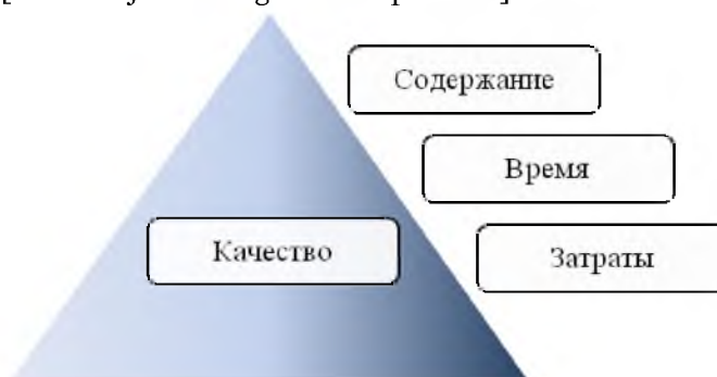
Рис 1. Тройственная ограниченность проекта Fig. 1. Triple limitation of the project

На рисунке 1 представлены основы требований, предъявляемых к проекту при условии равновесия четырех связанных составляющих — содержание, время, затраты (тройственная ограниченность) и качество [Сайт Project Management Experience].