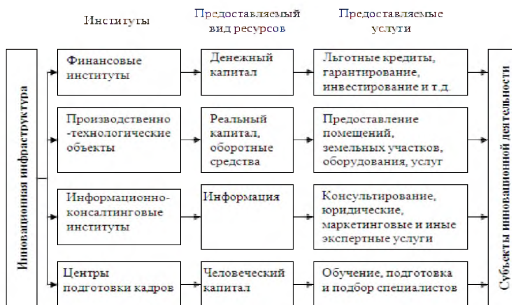
Рис. 1. Региональная инновационная инфраструктура Fig. 1. Regional innovation infrastructure

В рамках институционального подхода региональная инновационная инфраструктура представляет собой территориальную организационно-экономическую систему основных и оборотных материально-технических ресурсов, высококвалифицированных кадров, учреждений и объединений различных организационно-экономических форм деятельности, которые создадут благоприятные условия для функционирования инновационных организаций и становление развитой инновационной экономики на территории субъекта Российской Федерации (рис.1).