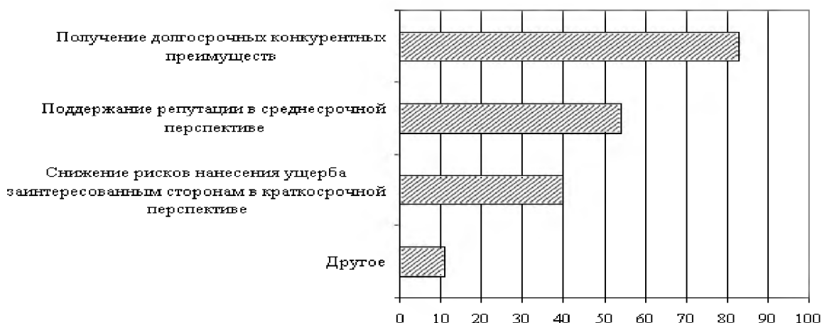
Рис. 2. Основные цели реализации стратегии компании в области социальной ответственности бизнеса [Благов и др., 2008]

На рис. 2 показаны основные цели реализации стратегии компании в области социальной ответственности бизнеса. Данные были получены на основании исследований, проведенных независимой общественной организацией «Ассоциация Менеджеров» в 2008 году.