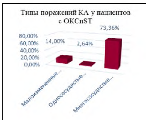
Рис. 1. Типы поражений КА у пациентов с ОКСпСТ (%) Fig. 1. Types of defeats of KA at patients with OKSpST (%)

Стоит отметить, что и в 1-ой и во 2-ой подгруппе превалировал множественный тип поражения сосудистого русла (75% и 69% соответственно; p > 0.05 ), однососудистый тип поражения несколько чаще встречались во 2-ой подгруппе (31% и 21% соответственно; p > 0.05 ) (рис. 2).