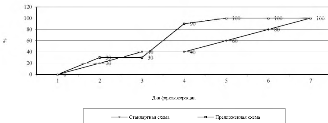
Рис. 3. Сравнение применения стандартной и предлагаемой схем фармакокоррекции ААС в структуре АЗ (F10.2)

Из приведенных данных видно, что при использовании предложенной схемы фармакокоррекции ААС в структуре АЗ (F10.2) уже со 2-го дня наблюдается уменьшение проявлений ААС на 10% по сравнению со стандартной схемой, а уже с 4-го дня наблюдается исчезновение проявлений абстиненции у 90% пациентов, что на 50% больше чем при использовании стандартной схемы фармакокоррекции ААС. Кроме того, полное купирование абстинентного состояния (100%), вызванного развитием АЗ при использовании предложенной схемы фармакокоррекции ААС наблюдается уже на 5-й день лечения, а при использовании стандартной схемы такого состояния можно достичь только на седьмой день фармакокоррекции. Более наглядно результаты применения стандартной и предлагаемой схем фармакокоррекции ААС можно представить графически (рис. 3).