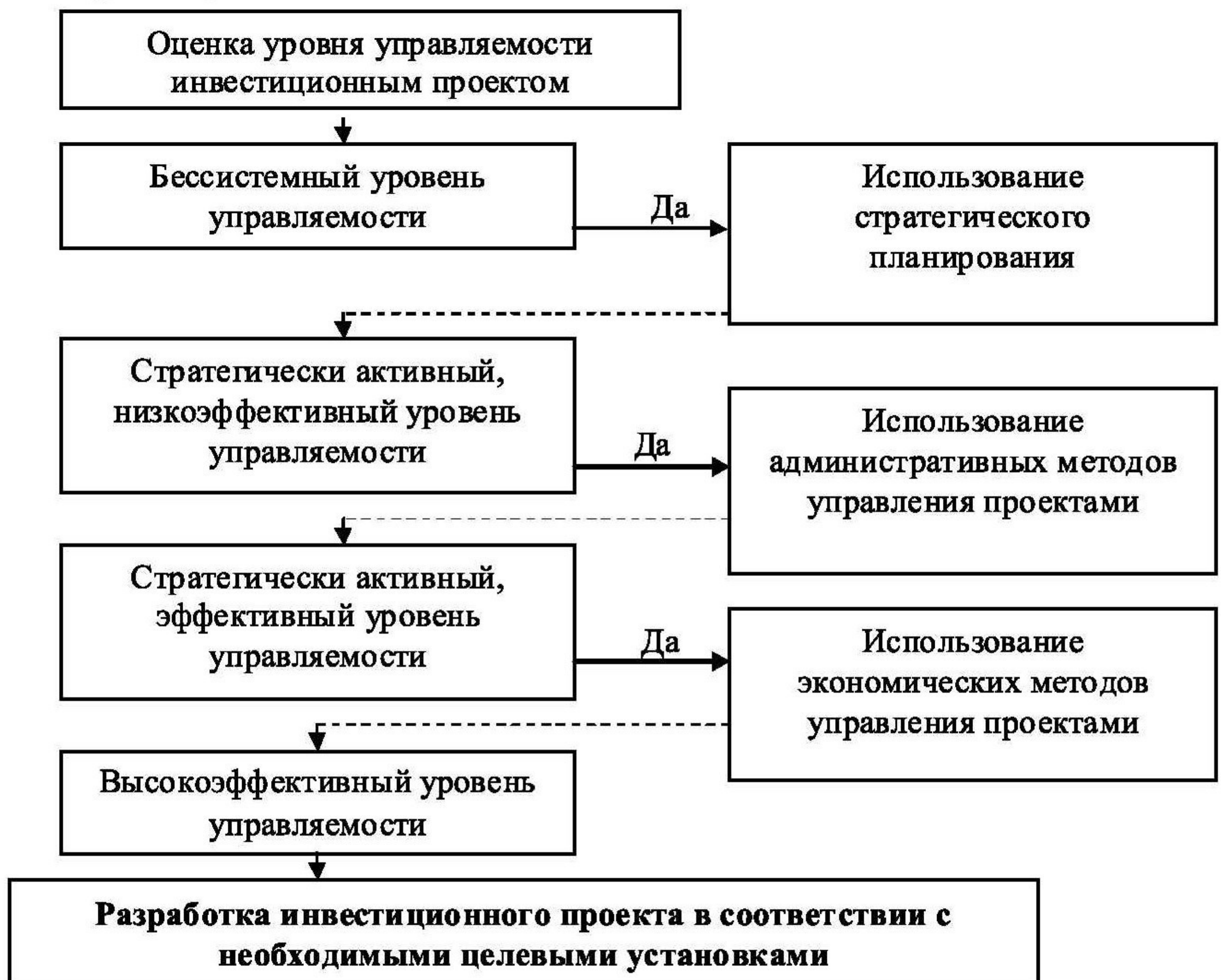
Рис. 2. Алгоритм выбора решений при управлении инвестиционным проектом

Для повышения уровня управляемости региональных инвестиционных проектов со стороны органов власти предлагается алгоритм выбора решений, который определяет направления для совершенствования этой деятельности (рис. 2).