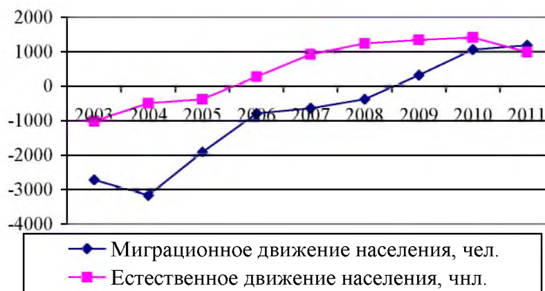
Рис. 1. Динамика естественного и миграционного движения населения г. Читы

По показателям естественного движения населения среди городов прирост жителей в 2011 году наблюдался только у 7, а миграционный приток только у 2 [15]. Не способствуют удержанию жителей социально-экономические потенциалы и непосредственная близость к границе городов Краснокаменска и Борзи, демонстрирующие в показателях преобладание числа покинувших города над приехавшими на новое место жительства.