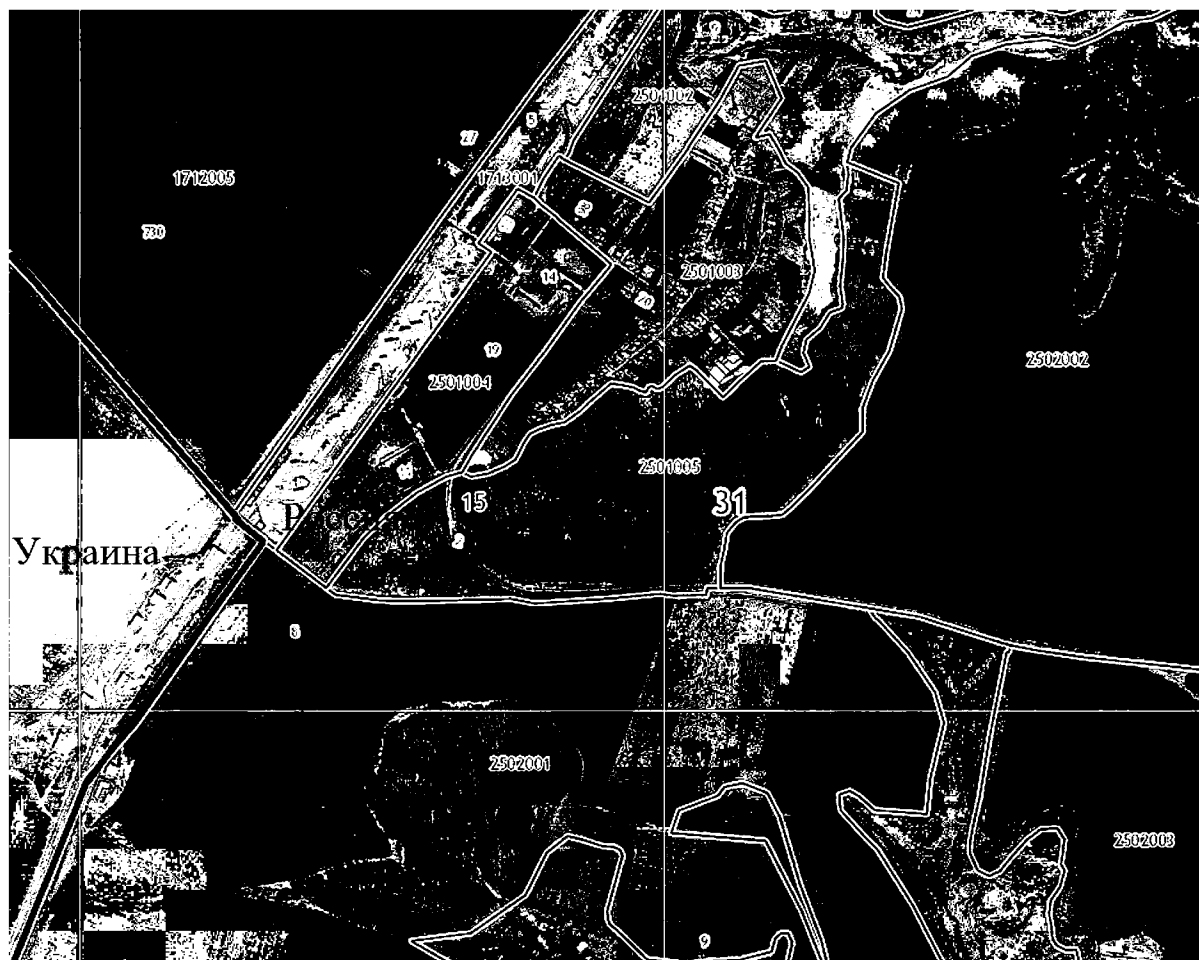
Рис. 3. Данные публичной кадастровой карты России (район пограничного пункта пропуска на украинско-российской границе «Гоптовка – Нехотеевка»)

Так, например, согласно новой схеме территориально планирования муниципального образования Белгородского района Белгородской области [6] развитие приграничных территорий Белгородского района связано с ростом внешнеэкономической деятельности, в рамках которой особая роль отводится укреплению торгово-экономических и научно-технических связей с Украиной. Активизации экономического сотрудничества будет способствовать соглашение между Белгородской и Харьковской областями о создании еврорегиона «Слобожанщина». Основным инфраструктурным элементом еврорегиона является приграничный торгово-выставочный комплекс, который предлагается расположить на территории государственной границы Украины с Российской Федерацией, прилегающей к международному автомобильному пункту пропуска «Гоптовка-Нехотеевка» (автомобильная стратегическая трасса Москва-Харьков-Симферополь), а также международный аэропорт, отвечающий последним мировым стандартам. Приграничный экспоцентр облегчит доступ мелких и средних экспортеров на соседние рынки. Проект развития Слобожанщины предполагает, что приграничная инфраструктура, будет включать международный аэропорт, торгово-выставочный центр, гостиничный комплекс, таможенный терминал, автомобильные и железнодорожные скоростные линии, сеть супермаркетов, склады и другие элементы инфраструктуры.