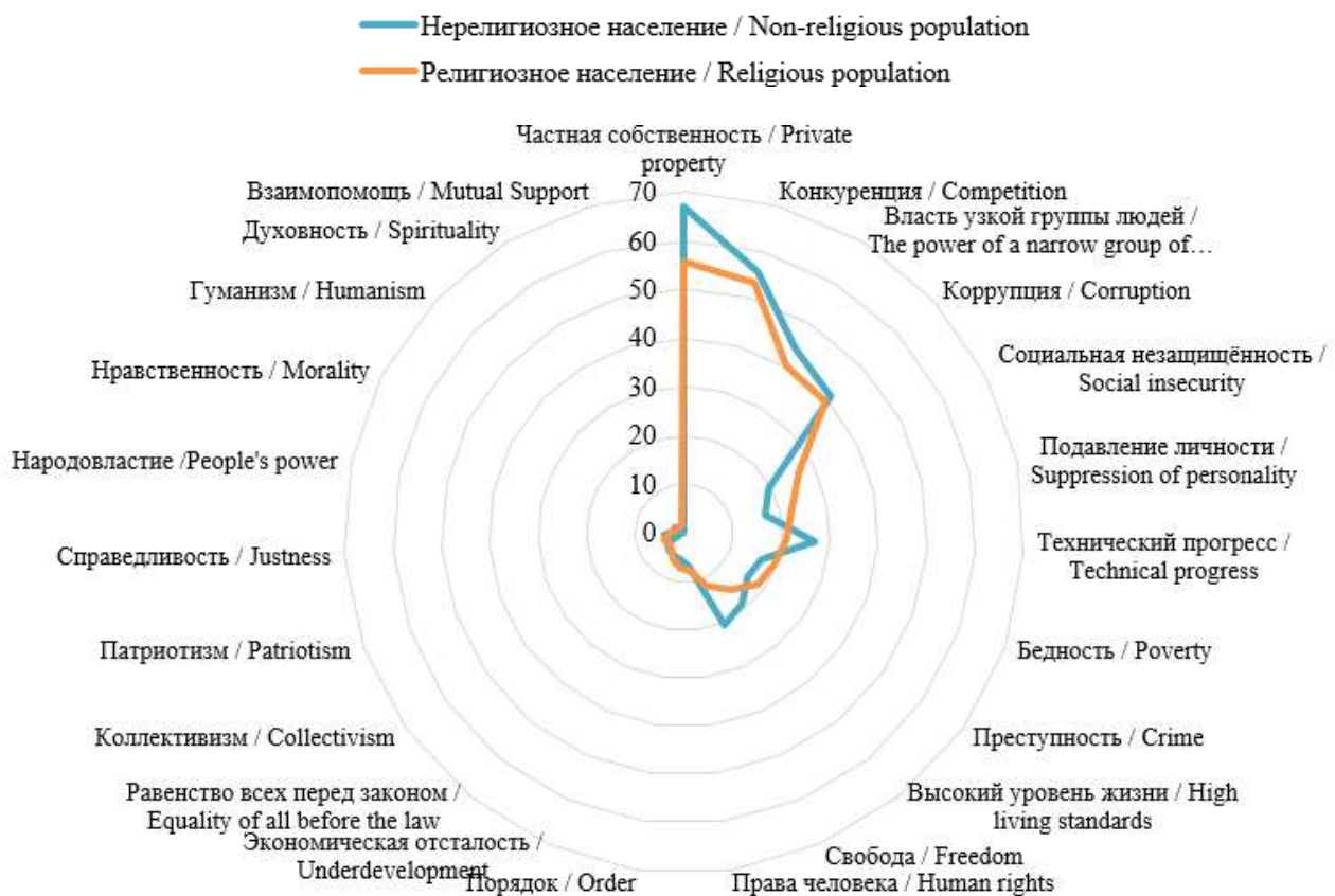
Рис. 2. Структура мнений респондентов типологических групп о том, что означает для них понятие «капитализм», в %