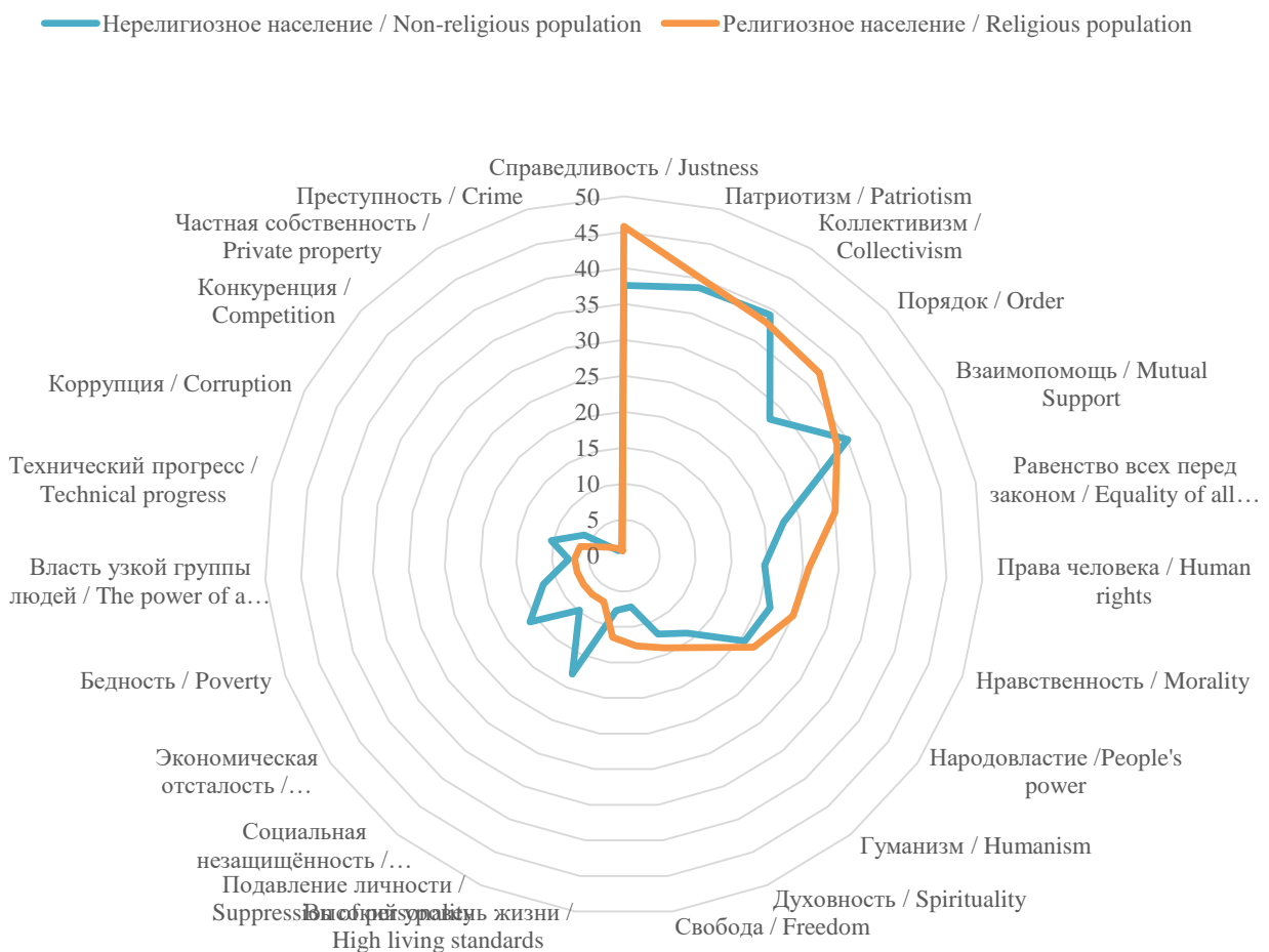
Рис. 1. Структура мнений респондентов типологических групп о том, что означает для них понятие «социализм», в %

Для нерелигиозного населения основным признаком социализма является его родовое свойство – «коллективизм» (39%). Заметим, что примерно такая же часть религиозного населения назвала «коллективизм» в числе главных понятий, присущих социализму. «Патриотизм» рассматривается в обеих изучаемых группах примерно одинаково. А «справедливость» нерелигиозное население определяет, как свойство, присущее социализму, гораздо реже: разница в оценках составляет 8,1 п.п.