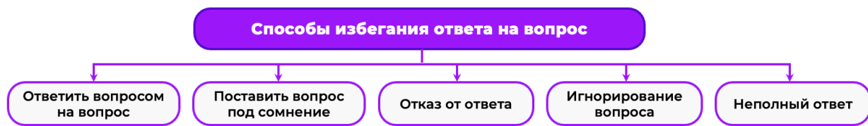
Рис. 5. Схема со способами избегания ответа на вопрос Fig. 5. A diagram with ways to avoid answering the question

Разрабатываемый алгоритм выявления уклончивости в ответах представляет собой сложную систему, основанную на двух обученных моделях, представляет собой обобщенный подход, который может использоваться для анализа диалогов или речи спикера.