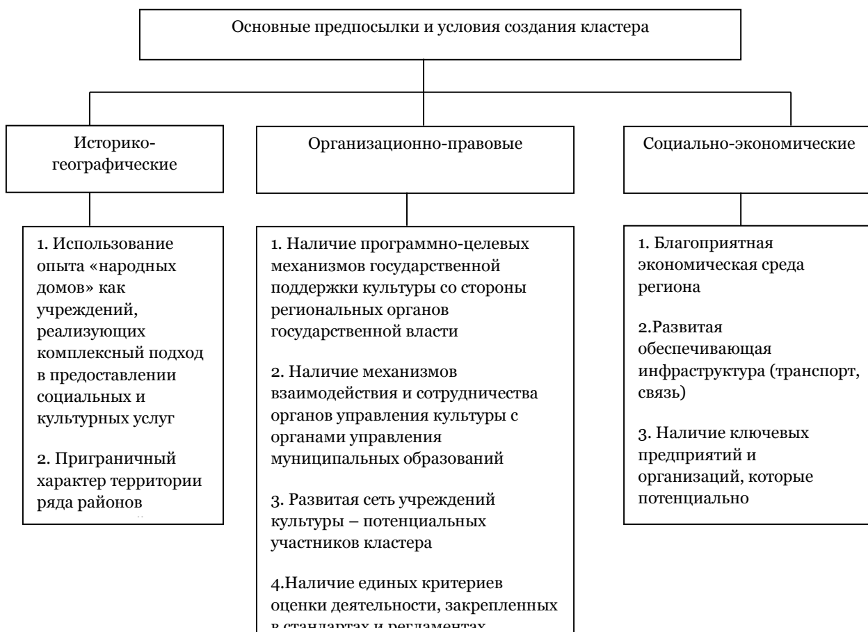
Рис. 1. Основные условия и предпосылки создания социокультурного кластера в Белгородской области

Мы полагаем, что в настоящее время в Белгородской области сложились необходимые условия и предпосылки для создания социокультурного кластера (рис. 1).