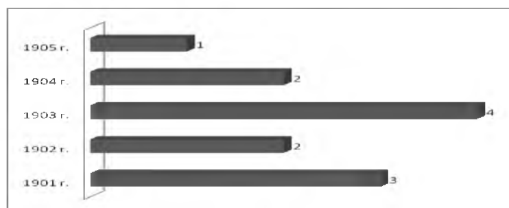
Рис. 2. Количество открывшихся библиотек ПОНТ в Костромской губернии

Из рис. 2 и рис. 3 наглядно становится понятна динамика возникновения библиотек ПОНТ в Костромской и Владимирской губерниях.