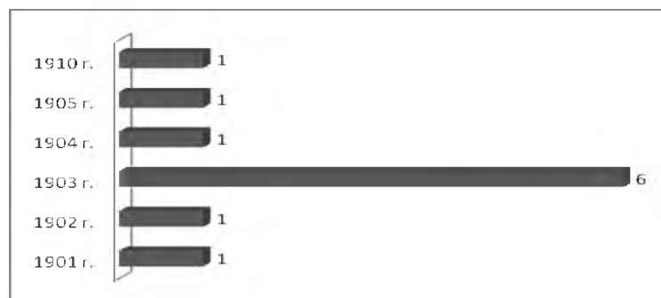
Рис. 3. Количество открывшихся библиотек ПОНТ во Владимирской губернии

Из рис. 2 видно, что в Костромской губернии процесс открытия народных библиотек ПОНТ занял пять лет и был достаточно равномерен в отличие от Владимирской губернии. В год здесь открывалось от 1 до 4 читален. Максимальное их количество пришлось на 1903 г.