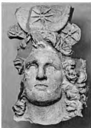
Рис. 7. Протома Мена. Амис, II-I вв. до н.э. (По С.Ю. Сапрыкину)