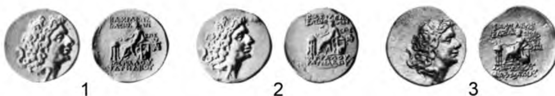
Рис. 2. Золото первого архонта Пантикапея, битое от имени Фарнака II

1, 2–243 г. б.э.; 3 – 244 г. б.э.; 4, 5 – статеры, выбитые штампами новых разновидностей в 245 г. б.э.; 6 – золотой этого же года, отчеканенный парой штампов, использованной в 243–244 гг. б.э.