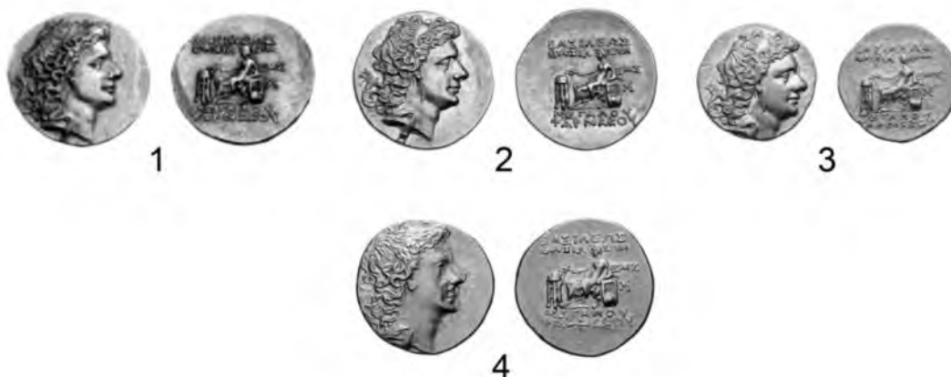
Рис. 3. Статеры Фарнака II херсонесского чекана