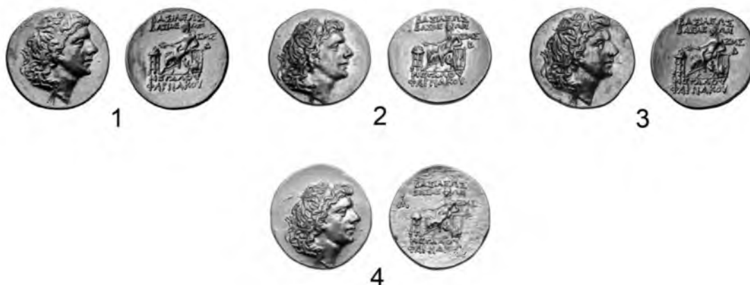
Рис. 5. Статеры чекана стратегии Диоскуриады (1–3) и Амиса (4)