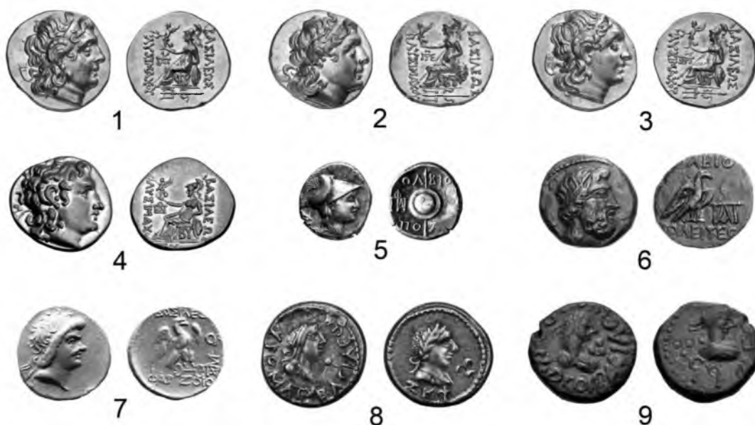
Рис. 6. Монеты государств Причерноморья с «П» – образными монограммами и с дифферентом «••»

1–4 – статеры т.н. лисимаховского типа чекана Византия с «П»-образными монограммами; 5 – дидрахма Ольвии, рубеж II-I вв. до н.э. На реверсе хорошо видна сложная «П»-образная монограмма; 6 – медная монета ольвийского чекана середины I в. н.э. На реверсе видна аббревиатура Π; 7 – статер Фарзоя (50/51 (?) – 76/77 гг. н.э.). Чекан Ольвии. На оборотной стороне монеты видна «П»-образная монограмма; 7,8 – боспорские статеры с дифферентом «••»: Тиберия Юлия Савромата III (7) и Фофорса (8).