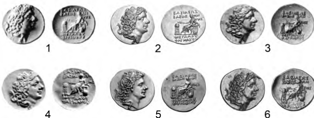
Рис. 1. Статеры Фарнака II чекана Пантикапея (царская эмиссия)

1, 2–243 г. б.э.; 3 – 244 г. б.э.; 4, 5 – статеры, выбитые штампами новых разновидностей в 245 г. б.э.; 6 – золотой этого же года, отчеканенный парой штампов, использованной в 243–244 гг. б.э.