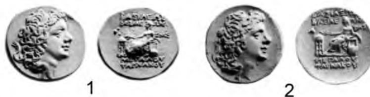
Рис. 4. Золотые монеты Фарнака II с дифферентами «••» (1) и «▲» (2)