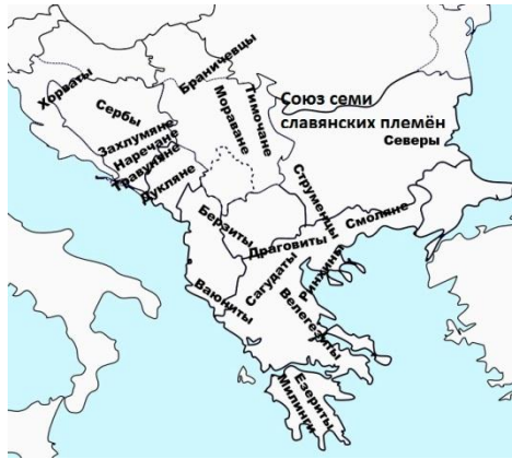
Рис. 1. Славянские племена в византийской Греции.

лась возможность пересмотреть проблемы славянской колонизации в этой стране.