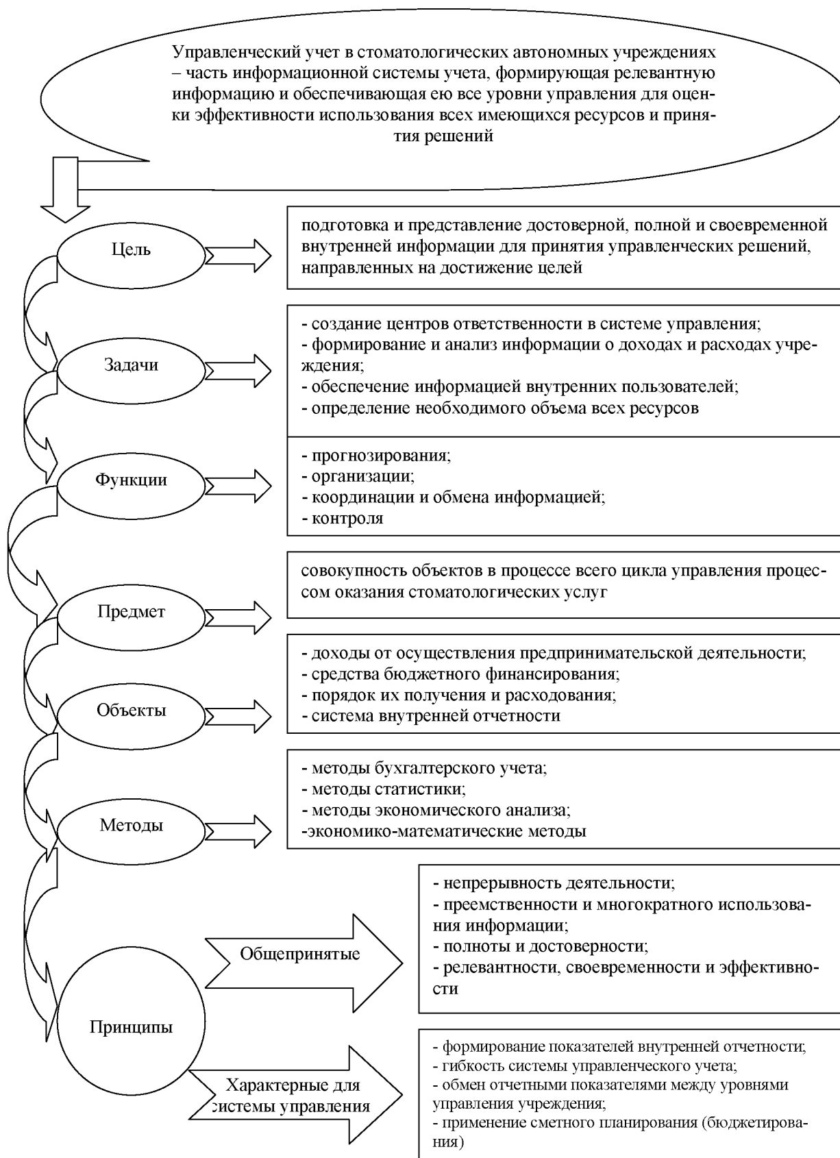
Рис. 2. Концептуальные основы учета в автономном стоматологическом учреждении