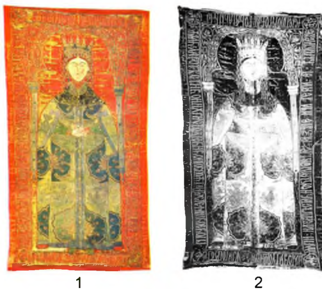
Рис. 5. Погребальная пелена Марии Асанины Палеологини из монастыря в Путне: 1—фотография; 2—прорись (по В.Л. Мыцу)