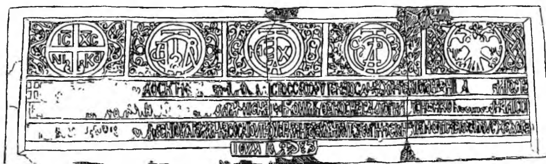
Рис. 3. Прорисовка надписи 1459 г. из Фуны (по В.Л. Мыцу)