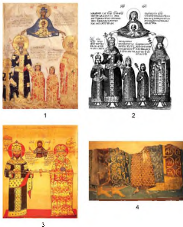
Рис. 4. Семейные портреты Палеологов и представителей родственных им семейств: 1—Мануил II Палеолог с семейством (Труды Дионисия Ареопагита, Париж, Лувр); 2—гравюра с этой миниатюры (по Ш. дю Фресне дю Канжу); 3—Алексий III Великий Комнин и Феодора Кантакузина на хрисовуле монастырю Дионисиат на Афоне (по С.П. Карпову); 4—изображения представителей родов Асанов и Дермокаитов из аркосолия внешнего нартекса церкви монастыря Хора в Константинополе.