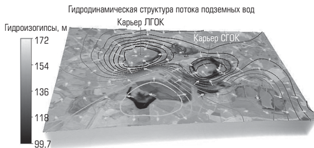
Рис. 1. Масштабы изменения уровня подземных вод

При этом целесообразно выделить следующие аспекты проекта «Большой карьер» LOP.