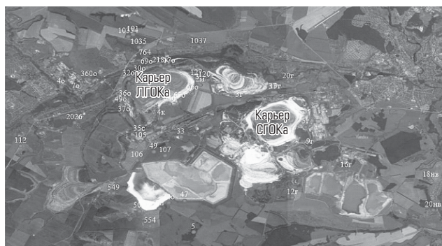
Рис. 2. Схема размещения наблюдательной сети скважин в Губкинско-Старооскольском горнорудном районе

1. Планирование ведения горных работ нацелено на минимизацию их воздействия на окружающую среду в плане снижения уровня и загрязнения подземных вод, уменьшения объема вскрышных работ, а следовательно, сокращения площадей земель, занятых отвалами пород, хвостохранилищами. Обязательным элементом в процессе проектирования и эксплуатации карьеров является оценка неопределенности данных и рисков [12].