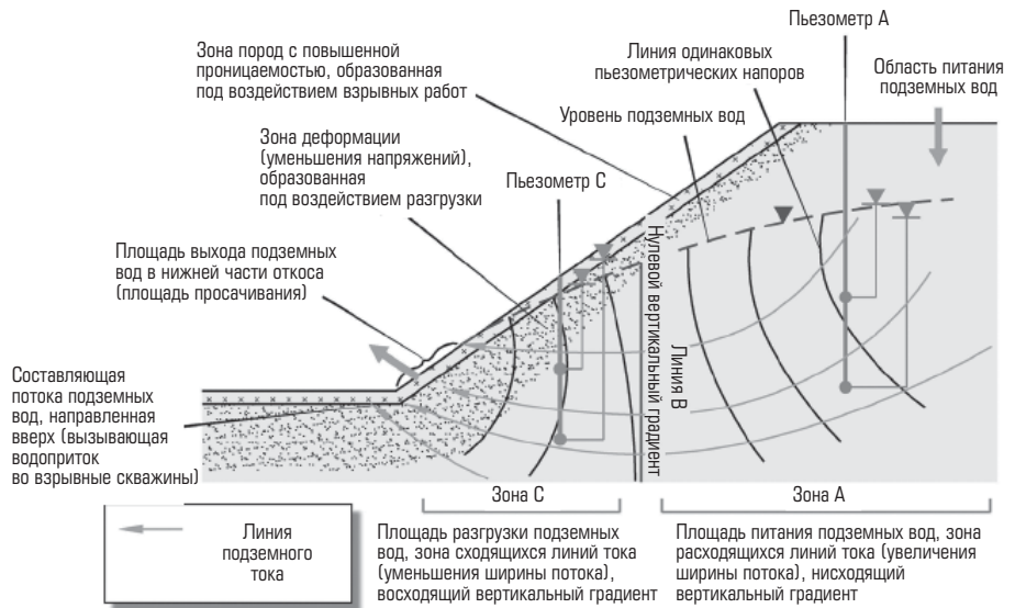
Рис. 3. Схема размещения пьезометров для определения вертикальных градиентов [7]

В современном понимании модель распределения порового давления – фильтрации состоит из концептуальной и численной моделей. Процедура подготовки концептуальной модели фильтрации предусматривает создание и ввод данных цифровой