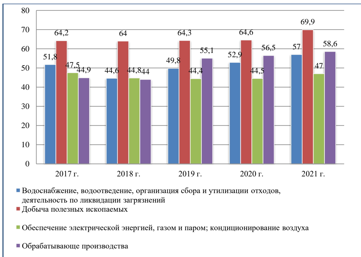
Рис. 1. Динамика износа основных фондов промышленных предприятий Оренбургской области по видам экономической деятельности, 2017-2021 гг., % Fig. 2. Dynamics of depreciation of fixed assets of industrial enterprises of the Orenburg region by type of economic activity, 2017-2021, %

В среднем во всех отраслях промышленности предприятий ПФО износ основных фондов составляет более 50 % (рисунок 1).