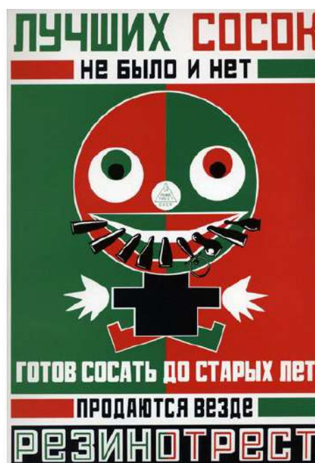
Рис. 11. «Лучших сосок не было и нет...» 12

В особенности это относится к рекламе папирос (рис. 12 и 13).