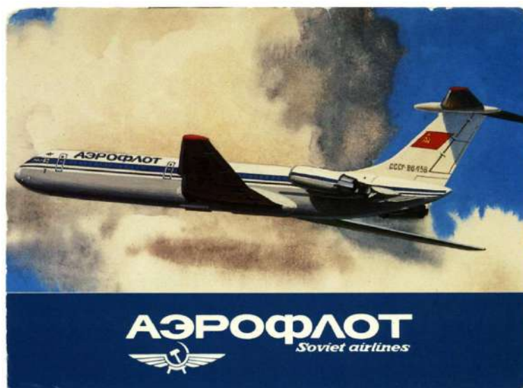
Рис. 15. Реклама авиакомпании «Аэрофлот» времен СССР 16 Fig. 15. Soviet-era Aeroflot advertisement

Помимо длинного текста важной составляющей рекламной кампании является шрифт. В винтажной рекламе расписанные вручную плакаты и рекламные щиты кинотеатров имели толстые шрифты и изменчивые штрихи, а эстетика была главным критерием дизайна. Шрифт должен бросаться в глаза и не быть слишком тонким и маленьким. Так, например, разработчики рекламы «Аэрофлота» еще со времен СССР знали, как привлечь внимание потребителей, создавая и сочетая гармоничные типы шрифтов (рис. 15).