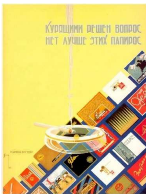
Рис. 13. «Курящими решен вопрос: нет лучше этих папирос» 14 Fig. 13. “The issue has been resolved by smokers. There is nothing better than these cigarettes”

Помимо рекламы сигарет в советские времена также можно было увидеть распространенную рекламу алкогольных напит-