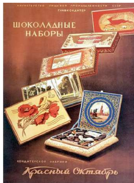
Рис. 10. Шоколадные наборы 11