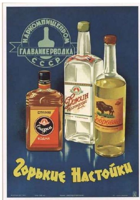
Рис. 14. Горькие настойки (Побединский А.) 15 Fig. 14. Bitters (Pobedinsky A.)

Что касается применения винтажной рекламы за рубежом, то в качестве примера можно взять исследование Международного исламского университета Малайзии, где подчеркивается, что воплощение в медиа исламских винтажных персонажей способствует развитию убеждений и ценностей у детей. В частности, это приумножает их знания об истории ислама и их любовь к пророкам и товарищам (Mubarak, 2020: 1).