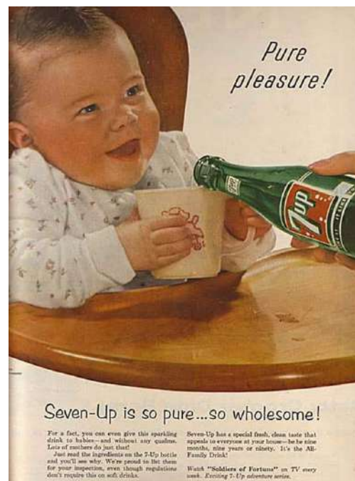
Рис. 5. Реклама газированного напитка 7UP 5 Fig. 5. "7UP" carbonated drink advertisement

В современном мире такая реклама может вызвать множество негативных комментариев, особенно от молодых родителей. Ведь если следовать этой рекламе и действительно дать младенцу подобный напиток, то это может обернуться печальными последствиями. Таким образом, хотя производители не всегда благоразумно подходили к созданию подобной рекламы, само ее появление в то время свидетельствует о достаточной лояльности к ней не только потребителей, но и закона как такового, что обусловлено деформацией культуры питания (Стоянов, Урывина, 2021: 94).