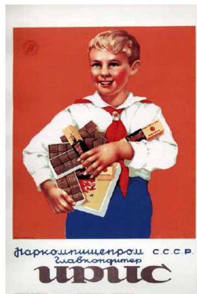
Рис. 8. Продукты питания в СССР 9 Fig. 8. Food products in the USSR