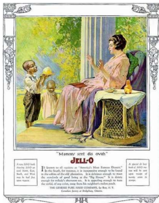
Рис. 4. Реклама пищевого бренда Jell-O 4 Fig. 4. Advertising of the food brand "Jell-O"

Подобная реклама не привлекла бы ни одного современного потребителя, поскольку в настоящее время подобные ситуации воспринимаются как дискриминация и принижение людей, относящихся к различным расам. Поэтому многие рекламные кампании, наоборот, стараются избавляться от расизма и привлекать как можно больше различных людей к участию в рекламе, создавая определенные коллаборации. Это свидетельствует о том, что проблема расизма вполне решаема в современном мире, особенно в контексте винтажной рекламы.