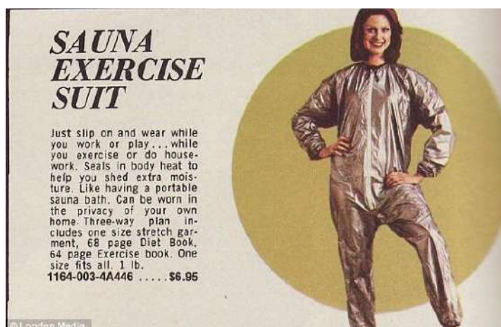
Рис. 2. Костюм для сауны 2 Fig. 2. Sauna suit