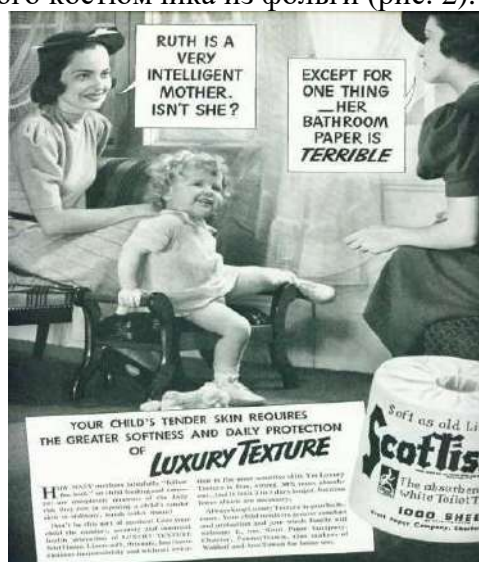
Рис. 1. Копировка из американской газеты 1 Fig. 1. Clipping from an American newspaper

Однако, с каждой вехой развития человечества, в рекламе появлялось нечто новое. Это могли быть некие товары или услуги, по которым можно судить об обстановке их времен. Как жилось нашим предшественницам в середине XX века, легко понять по вырезкам из американских газет (рис. 1), в которых есть все, что душе угодно: прибор для измерения красоты, создания ямочек, похудения, корсеты, волшебные штаны и многое другое. Кому не нравились модные штанишки с завышенной талией или универсальный корсет, могли сделать выбор в пользу такого вот веселого костюмчика из фольги (рис. 2).