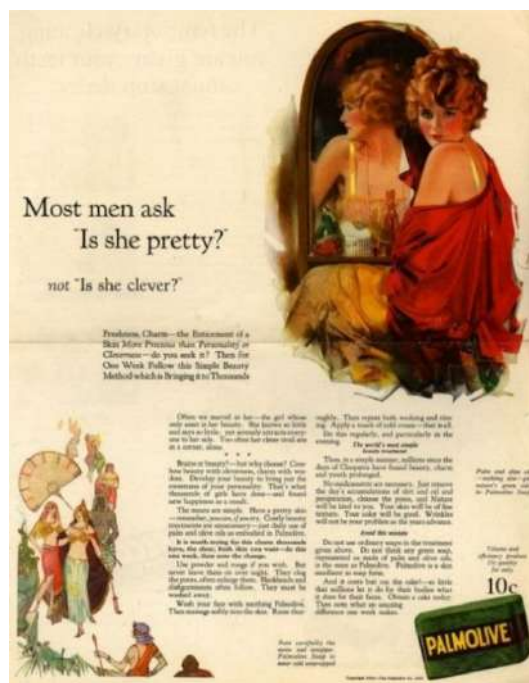
Рис. 3. Реклама мыла Palmolive 3 Fig. 3. “Palmolive” soap advertisement

Так, например, в 1924 году косметический бренд Palmolive запустил рекламу туалетного мыла (рис. 3), в которой уверял, что для женщины внешний вид важнее интеллекта. «Большинство мужчин спрашивают: “Она красива?”, а не “Она умна?”» – гласило сообщение на постере.