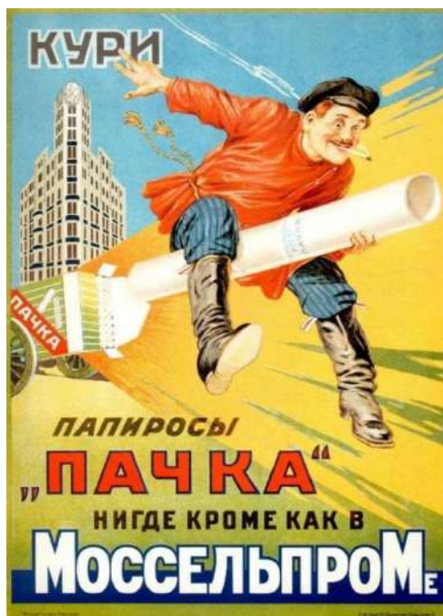
Рис. 12. Кури папиросы «Пачка» (Буланов М.) 13 Fig. 12. Smoke cigarettes “Pack” (Bulanov M.)