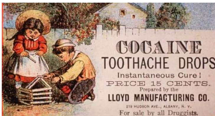
Рис. 6. Зубные капли 6 Fig. 6. Tooth drops

Не трудно догадаться, что подобные капли использовались в качестве анестезии, однако современное поколение осознанно бы отказалось от подобных препаратов.