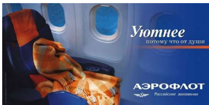
Рис. 16. Современная реклама авиакомпании «Аэрофлот» 17 Fig. 16. Modern Aeroflot advertisement

рассматриваемого «Аэрофлота», где шрифт подчеркивает и демонстрирует «уют», показанный в левой части картинки, причем соблюдая преемственность времен (рис. 16).