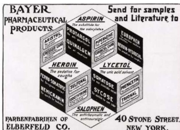
Рис. 7. Реклама аспирина и героина от Bayer в США 7 Fig. 7. Advertising of aspirin and heroin from Bayer in the USA

Аналогичная ситуация и с другими веществами, представленными на картинке (рис. 7).