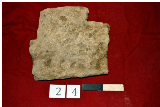
Рис. 2. Городище «Белинское». Раскоп «Восточный». Антропоморф из ямы № 140.