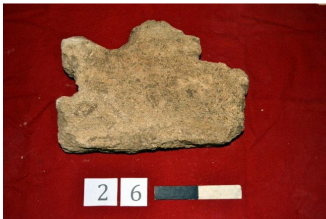
Рис. 1. Городище «Белинское». Раскоп «Восточный». Антропоморф из ямы № 122.

Key words: Sarmatians, Sarmatian tribes, Iazygs, Roxolans, Northern Black Sea region.