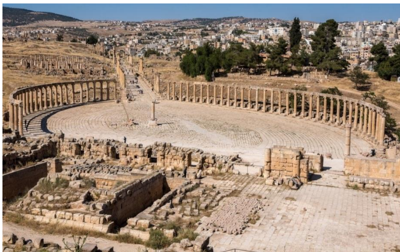
Рис. 3. Вид на Овальную площадь Герасы, Кардо и теменос храма Зевса.

Строительство города характеризовалось организованным планом, состоящим из двух улиц, одна из которых проходила с востока на запад – декуманус . Длина декумануса составляла 1459 м и представляла собой улицу с колоннадой 2 . Эта улица разделяла город на две основные части: северную и южную, в то время как другая улица, кардо , пересекалась с декуманусом под прямым углом 3 . Улицы были вымощены плиткой.