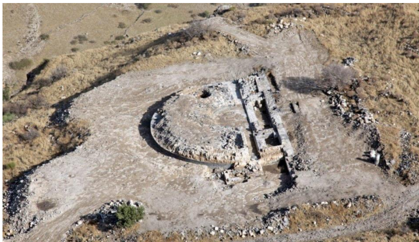
Рис. 2. Гиппос. Одеон. Аэроснимок.

- одеон – небольшая, крытая театральная площадка, которая использовалась в качестве места для декламации поэзии в сопровождении музыки.