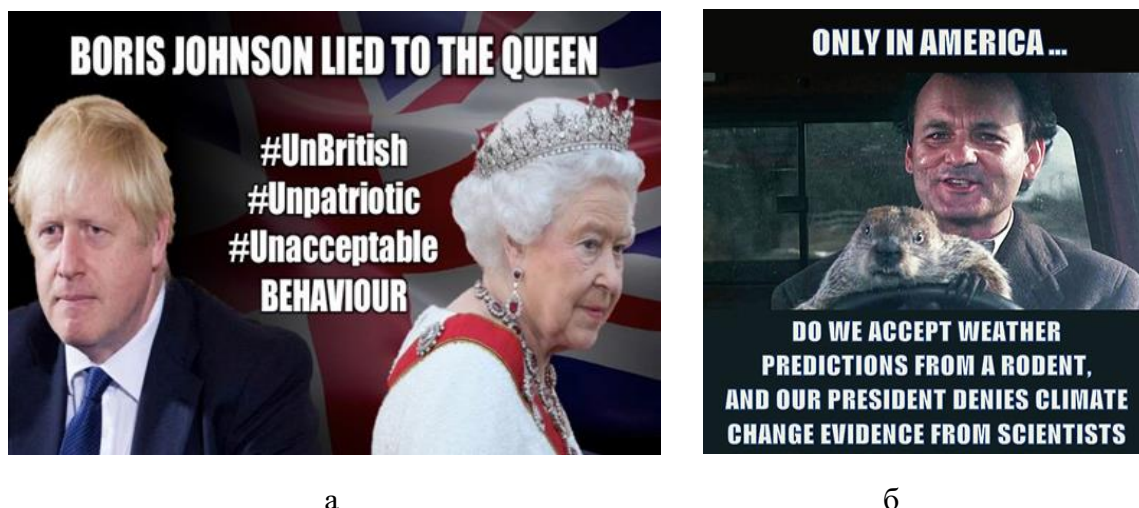
Рис. 6. Интернет-мем с карнавализацией 1, 2 Fig. 6. Carnavalized internet memes

Карнавализация юмора воплощается также в шутовстве и дурачестве, которые являются неотъемлемыми атрибутами карнавальной культуры [Бахтин, 1990]. Юмор в интернет-мемах отличается игровой направленностью и часто основан на нелепости, абсурде, фарсе, свойственных средневековым шутам. Визуализированность интернет-мемов добавляет оттенок зрелищности и театральности, без которых также не обходились выходки средневековых шутов.