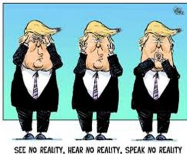
Рис. 1. Интернет-мем с сатирической характеристикой 1 Fig. 1. Satirical internet meme

Рассмотрим пример на рис. 1. В данном интернет-меме наблюдается сатира, потому что автор мема обличает отрицательные стороны политики президента США Дональда Трампа. Сопроводительная надпись переводится так: «Не вижу реальную действительность, не слышу реальную действительность, не говорю то, что соответствует реальной действительности». Графический ряд визуализирует вербальный компонент в карикатурном виде. В интернет-меме имплицитно выражена идея о том, что Д. Трамп игнорирует факты, не признает реальное положение дел, и не говорит правду. Юмор в данном меме выражен в полимодальной форме с опорой на вербальный и визуальный компоненты. Средствами создания юмористической направленности служат карикатурные портреты Д. Трампа, а также параллелизм, лексические повторы и градация в вербальном компоненте.