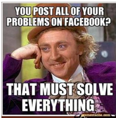
Рис. 2. Интернет-мем, передающий сарказм 1 Fig. 2. Sarcastic internet meme