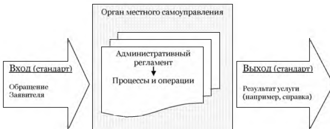
Рис 3. Логическая модель места административного регламента в процессе оказания муниципальной услуги

Административный регламент беспристрастно регламентирует нормативными и правовыми актами процесс выполнения какой-либо услуги, создает условия для общедоступности и нивелирования возможности влияния на объект интереса. Для местного самоуправления «Электронные административные регламенты» – это реализация процедур, прав и обязанностей органов местной власти и их учреждений, а также отдельных должностных лиц с использованием современных информационных технологий.