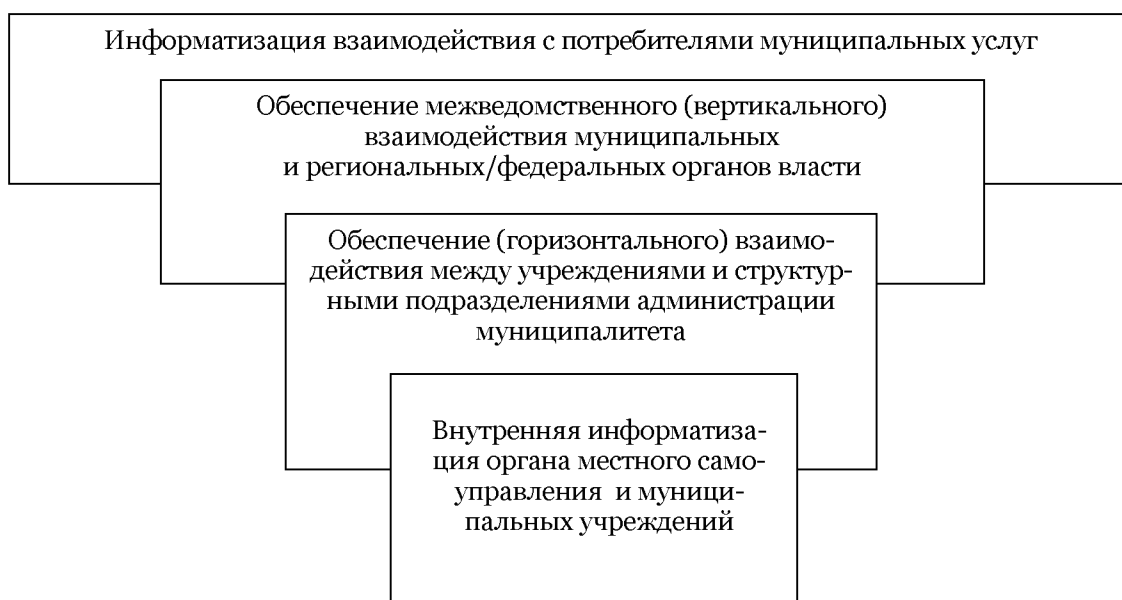
Рис 1. Муниципальный аспект реализации уровней электронного взаимодействия

Использование сервисно-функциональной модели управления, основными элементами которой являются муниципальная услуга и муниципальная функция, выступающие как разнонаправленные взгляды на деятельность органов местного самоуправления, во многом преломляет «традиционные» способы взаимодействия муниципальных органов власти с внешней средой. С объектами этой внешней среды на четырех уровнях устанавливаются информационные взаимоотношения, представленные на рис. 1.