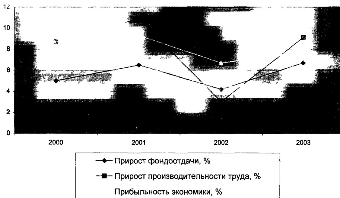
Рис. 2. Динамика показателей эффективности общественного производства в 2000-2003 гг

капиталоемкость, достигнув в 2000г. наименьшего значения за весь период 1997-2003 гг., в 2002-2003 гг. стремительно росла, после чего, в 2003 г., наблюдалось её снижение.