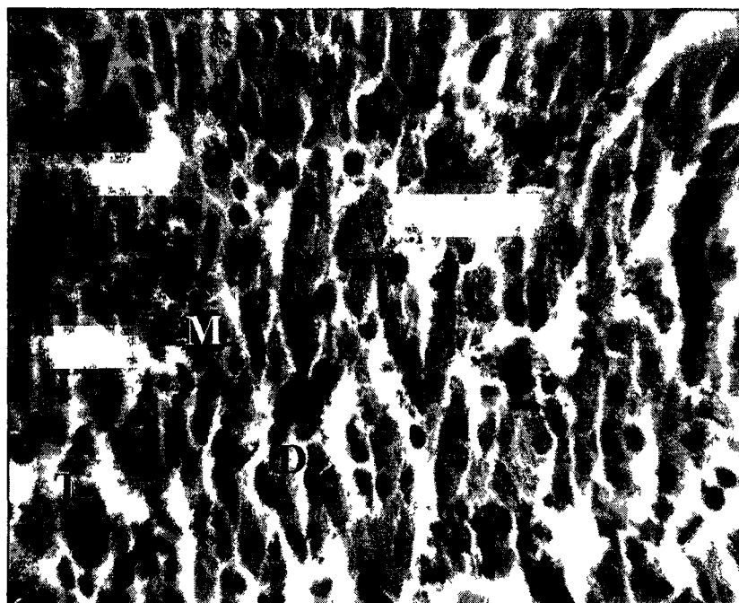
Рис. 1. Анизоцитоз, двуядерные клетки и отдельно лежащие гепатоциты в печени R. ridibunda .

строения печени явно имеют патологический характер, но не характерны для млекопитающих. У млекопитающих при заболеваниях печени часто наблюдается фиброз. У лягушек мы наблюдали противоположное явление: редукцию коллагеновых прослоек, составляющих каркас печени. Окрашивание по Маллори подтверждает наш вывод. Другим специфическим для амфибий признаком является замещение типичных гепатоцитов мелкими вытянутыми клетками. Вероятно, мы видим зоны регенерации; составляющие их клетки могут представлять собой продукты ускоренной, «аварийной» дифференцировки, в результате которой возникают гепатоциты с меньшей плоидностью. При анизоцитозе также отмечаются очень крупные двуядерные гепатоциты, не характерные для амфибий в норме (рис 1, 2.) И то, и другое демонстрирует нам появление нетипичных, по-видимому, функционально неполноценных гепатоцитов.